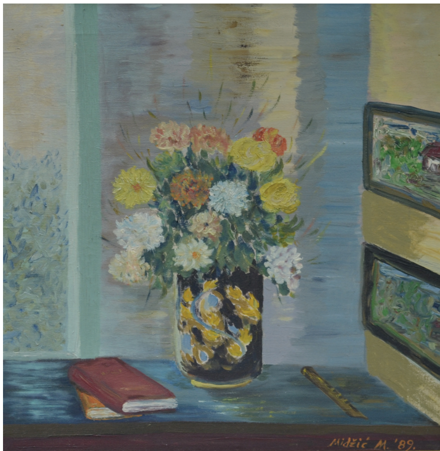
Cvijeće , ulje na platnu, 47x41 cm, 1989. godina