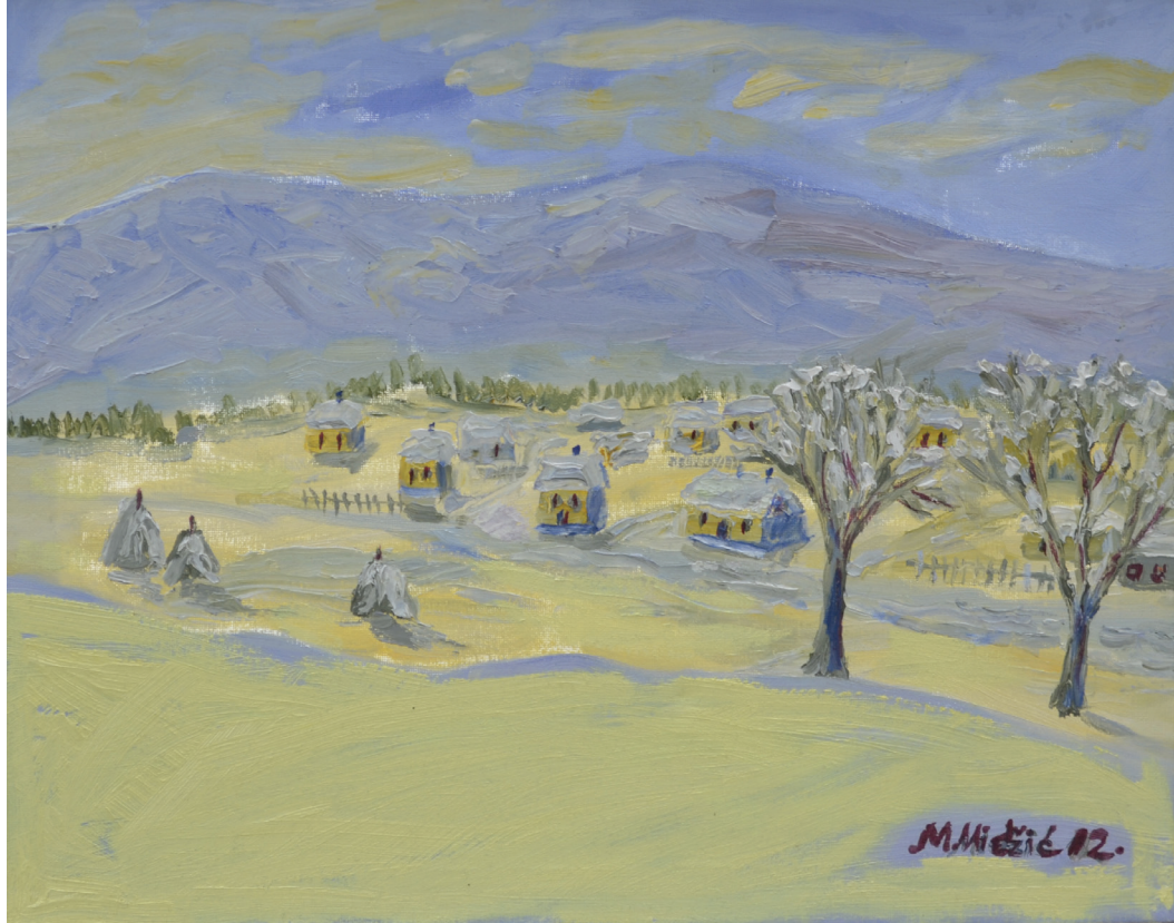
Zima u selu , ulje na platnu, 40x50cm, 2012. godina