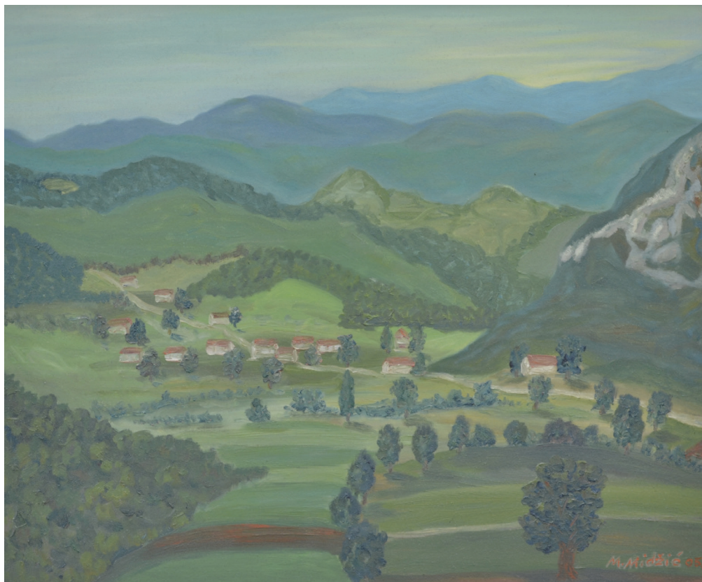
Dobrenica , ulje na platnu, 59x69 cm, 2005. godina