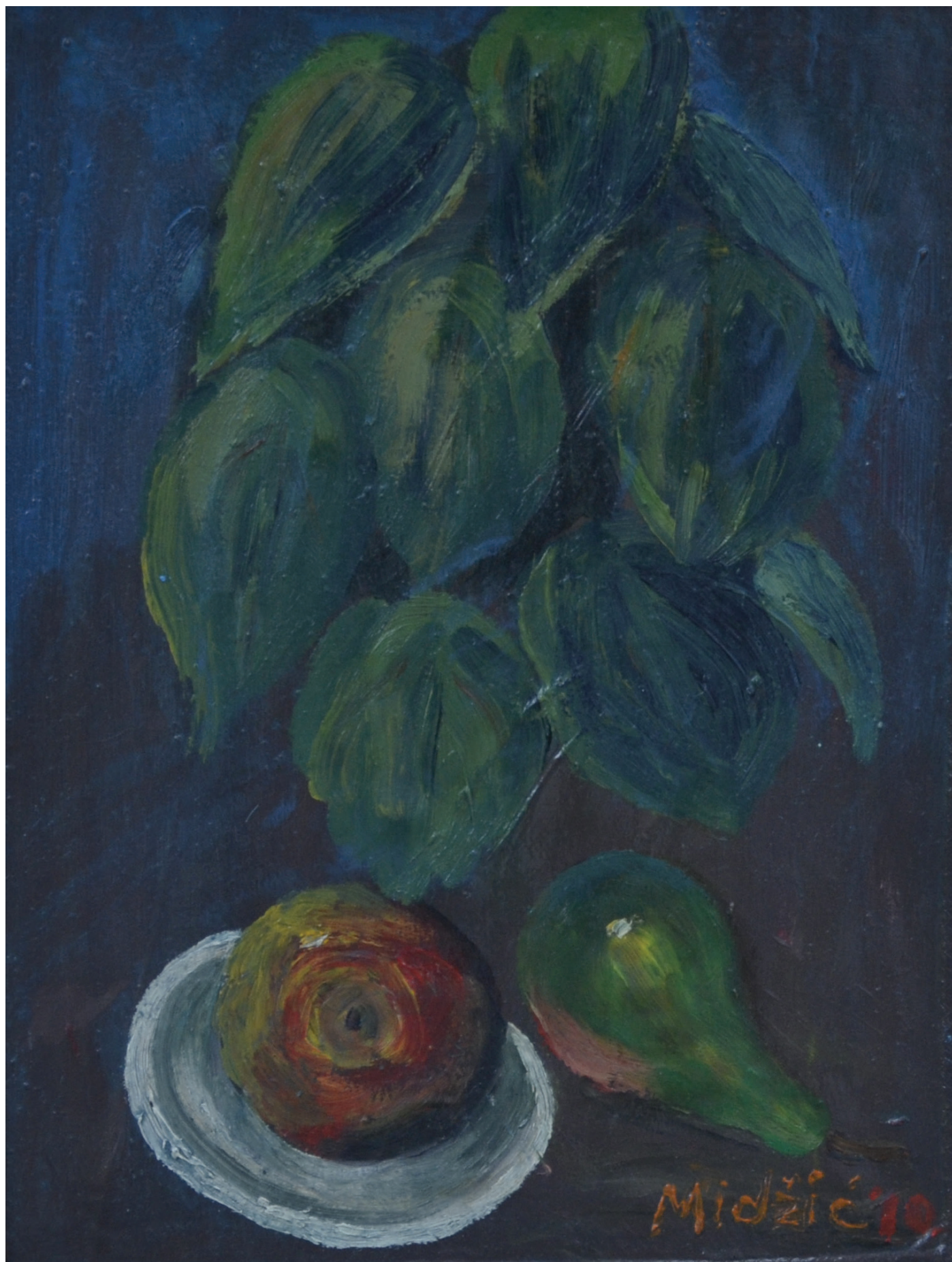
Kruška i jabuka , ulje na kaširanom platnu, 38x29 cm, 2010. godina