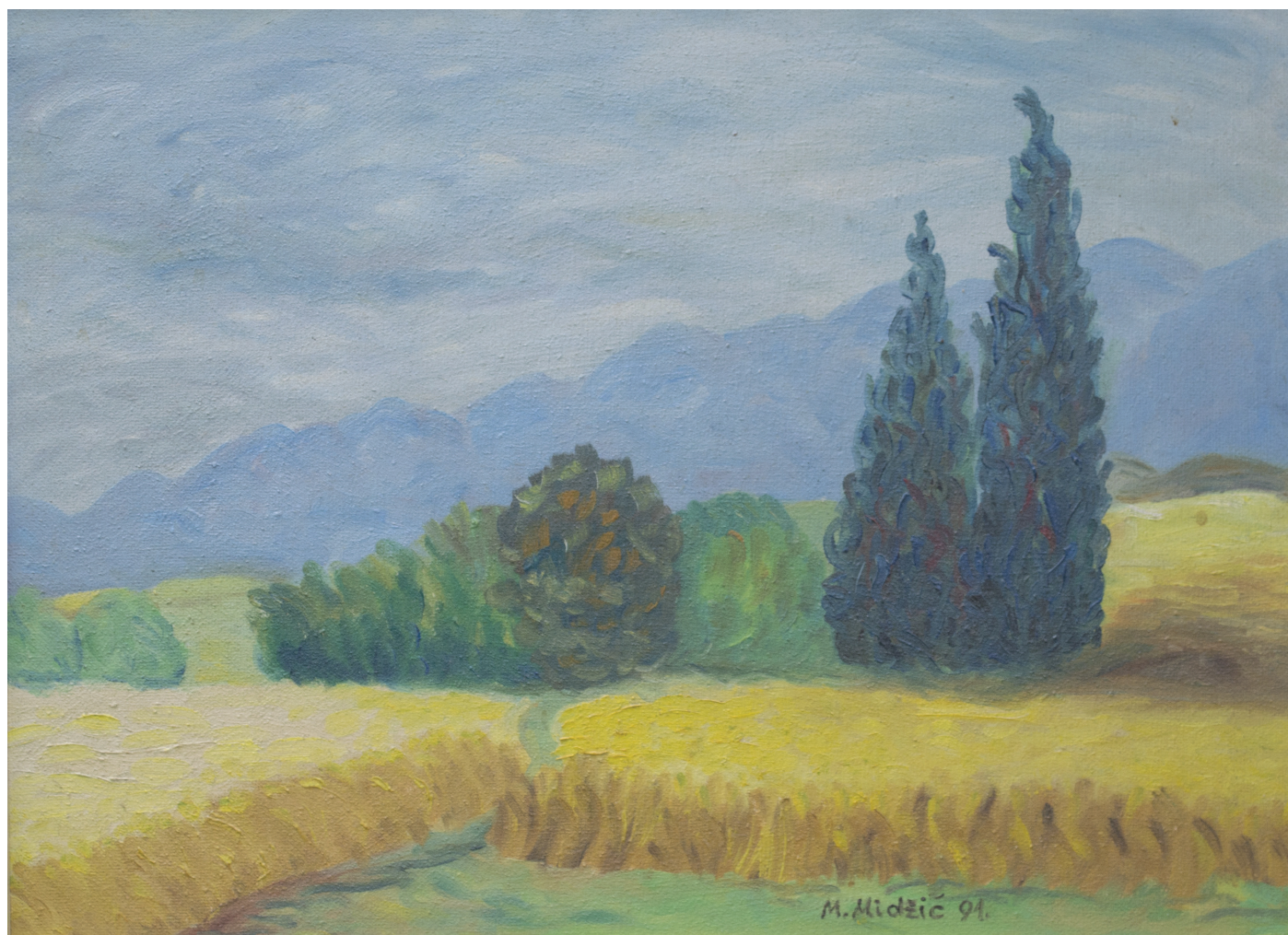
Žito, ulje na kaširanom platnu, 38x51 cm, 1991. godina