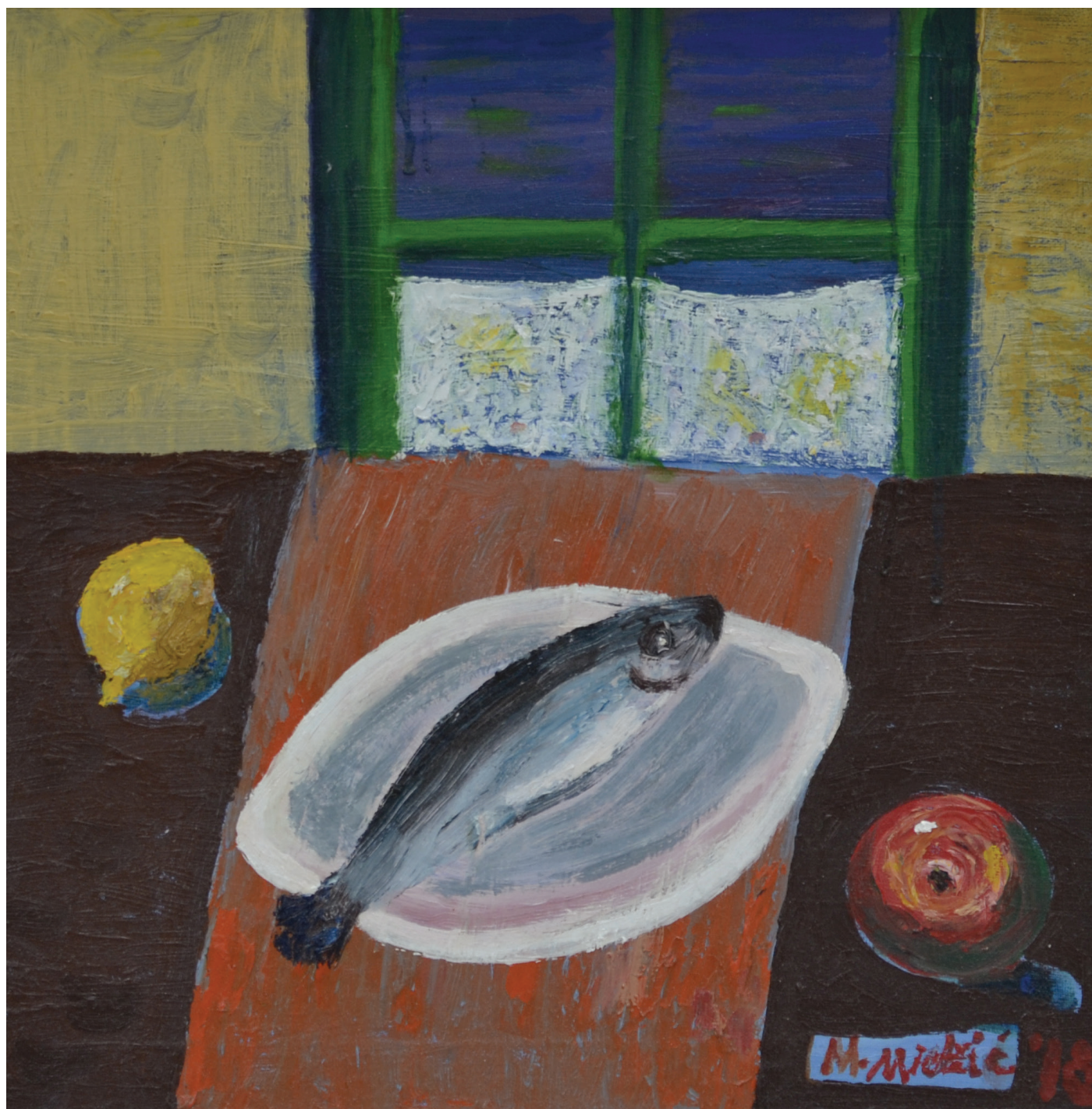
Mrtva priroda , ulje na platnu, 46x46 cm, 2018. godina