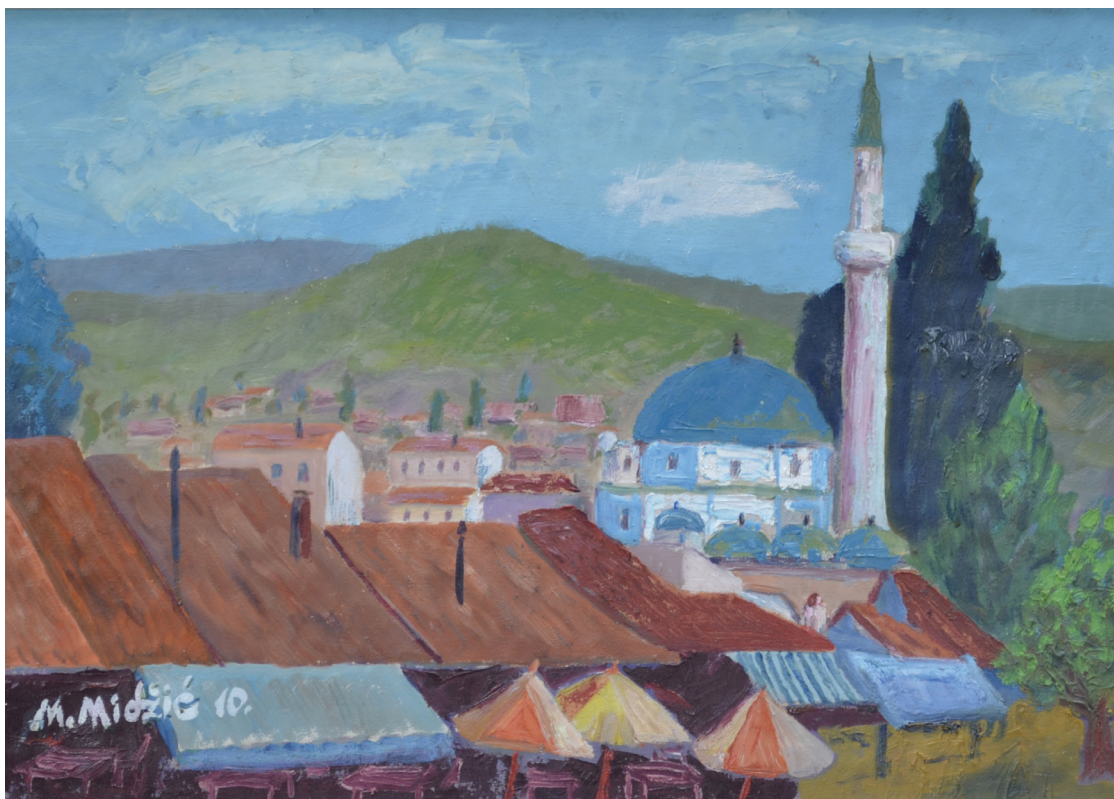
Bašćaršija , 50x70 cm, ulje na platnu, 2010. godina