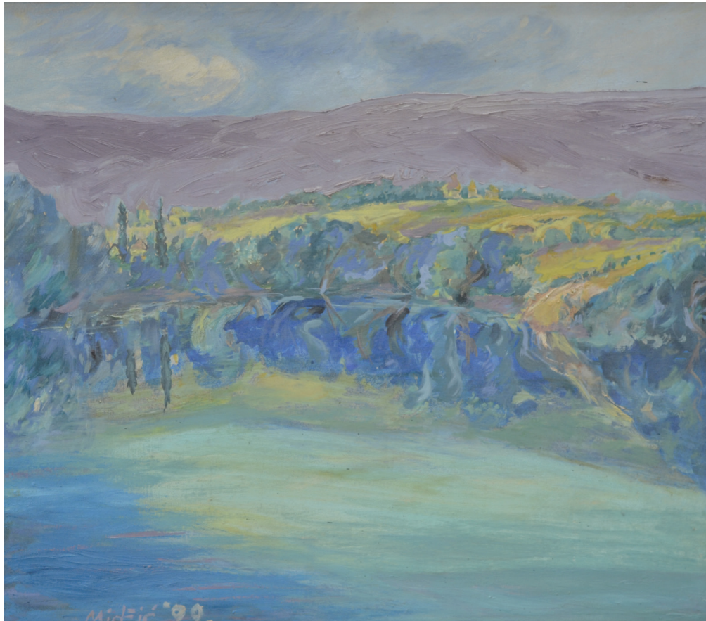
Una , ulje na platnu, 49x53 cm, 1999. godina