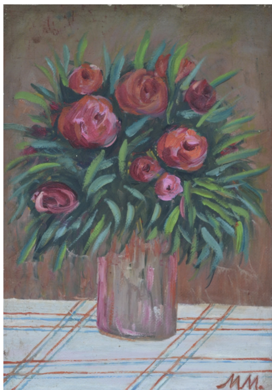
Ruže, ulje na dasci, 30x24 cm