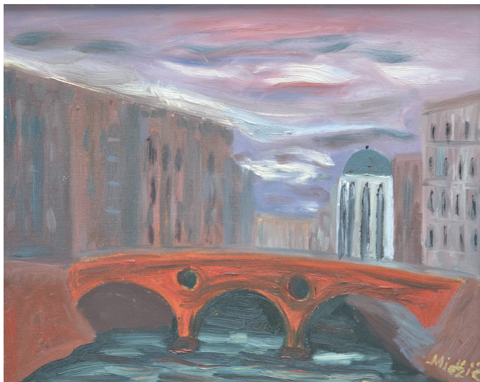
Latinska ćuprija , ulje na platnu 49x59 cm