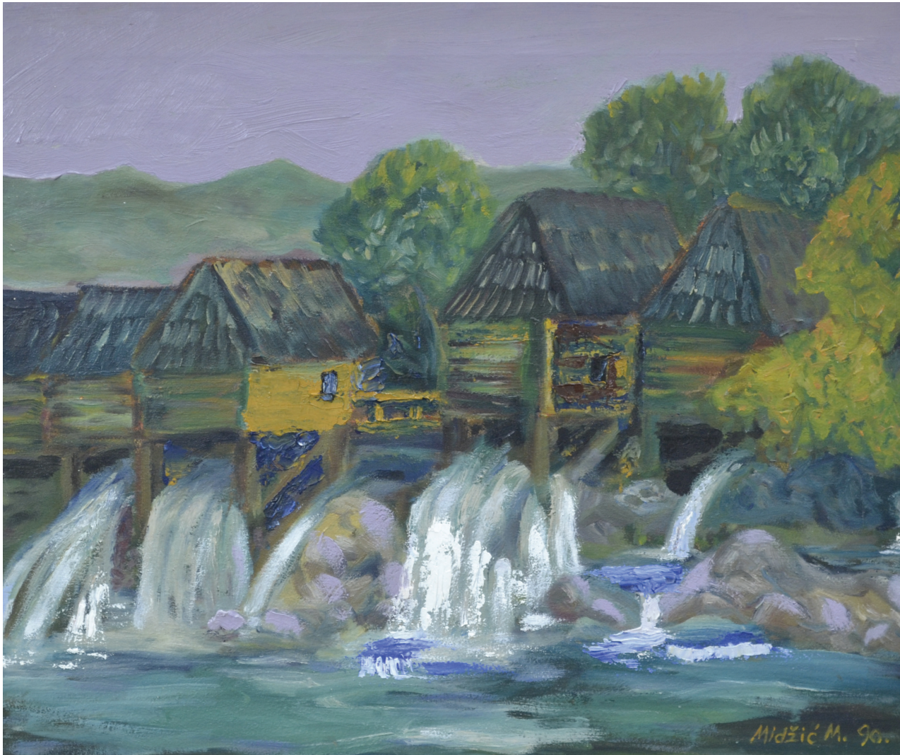
Mlinovi , ulje na platnu, 45x55 cm, 1990. godina