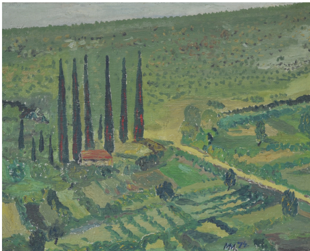
Motiv iz Crne Gore , ulje na platnu, 40x49 cm, 1974. godina