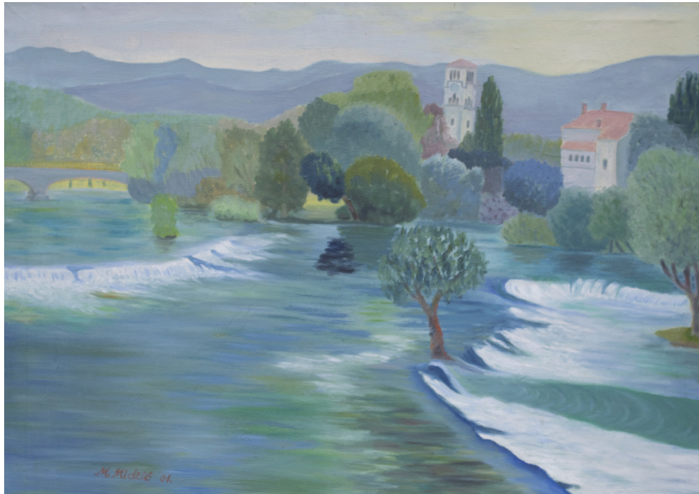
Una u Bihaću , ulje na platnu, 73x93 cm, 2001. godina