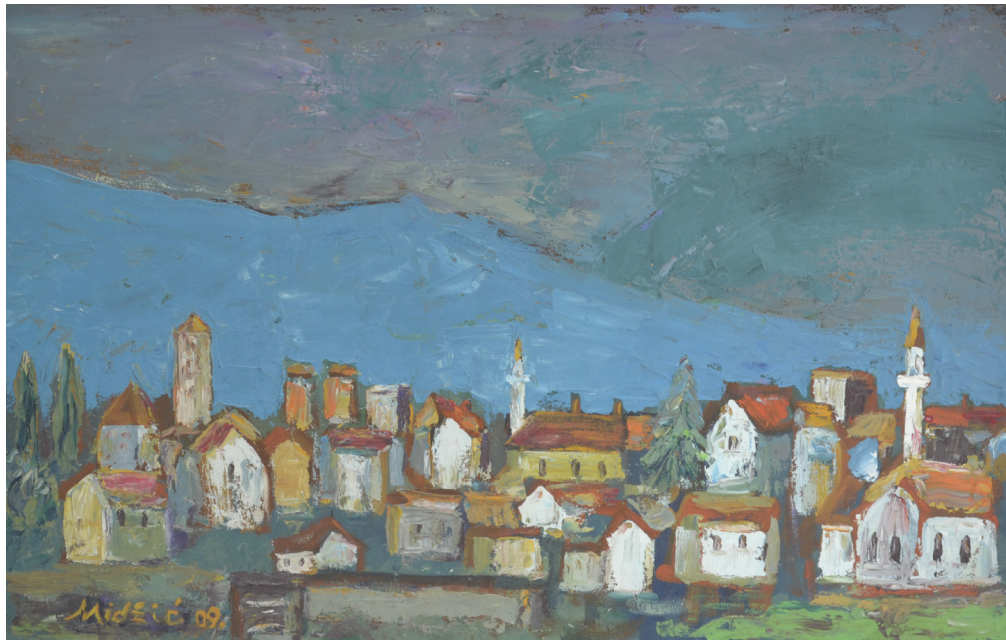
Bihać , ulje na platnu, 59x90 cm, 2009. godina