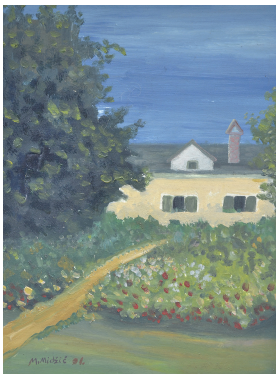
Kuća u vrtu , ulje na platnu, 47x34 cm, 1991. godina