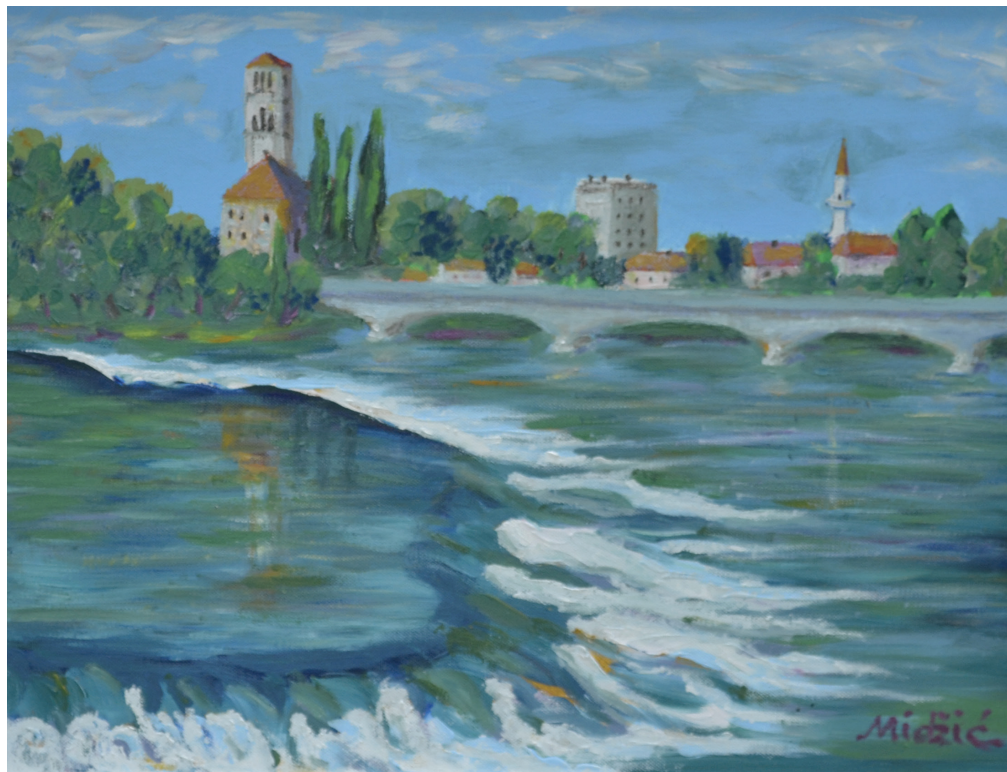
Bihać, ulje na platnu, 39x49 cm