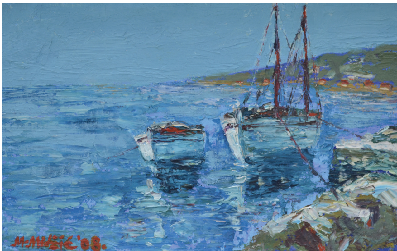
Barke, ulje na kartonu, 30x48 cm, 2008. godina