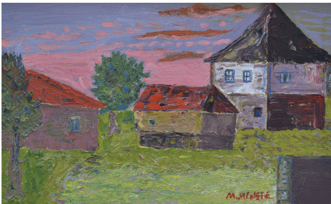
Selo , ulje na platnu, 46x70 cm