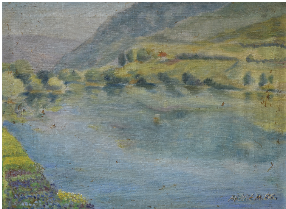
Una u Lohovu , 40x50 cm, ulje na platnu, 1986. godina