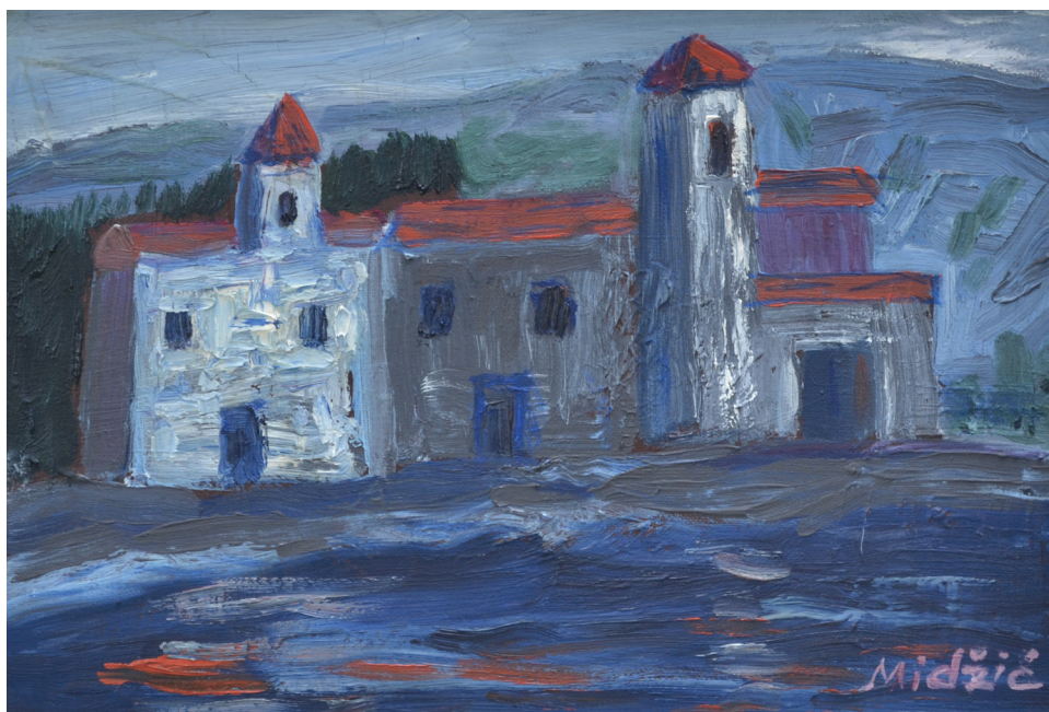
Crkva , ulje na platnu, 29x39 cm