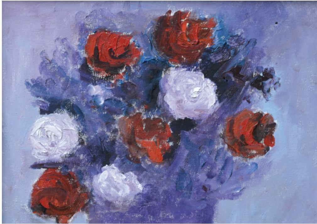
Ruže , ulje na platnu, 29x29 cm