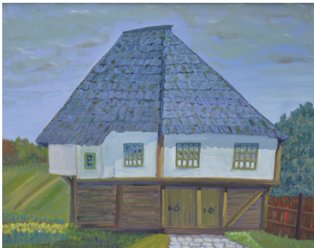
Krajiška kuća , ulje na platnu, 58x69 cm