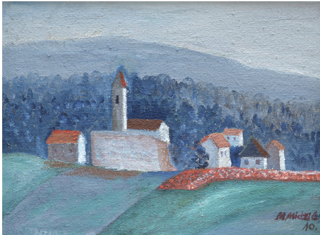
Selo , ulje na platnu, 45x59 cm