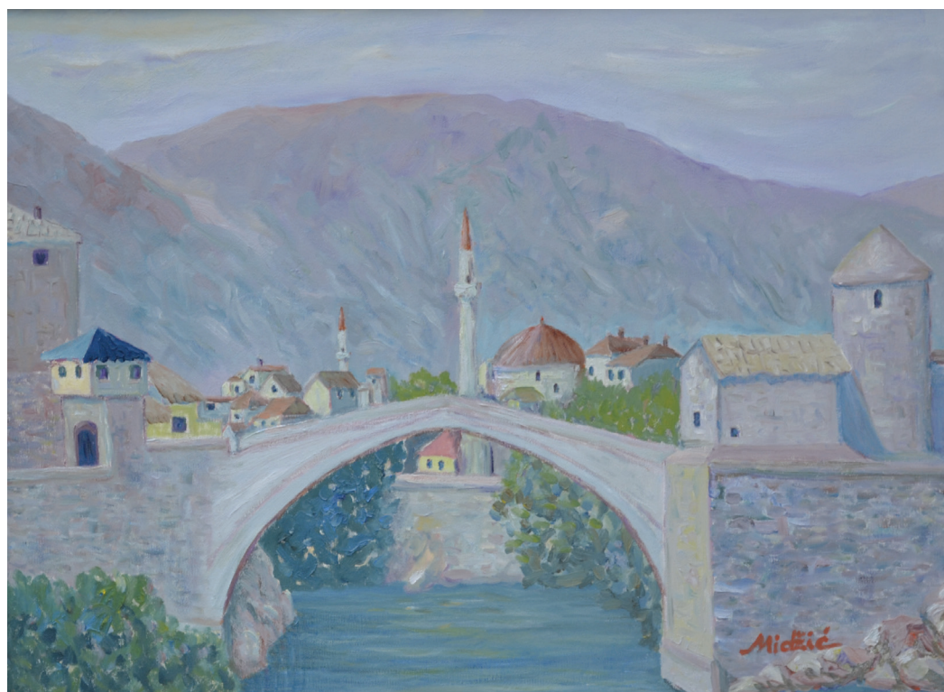
Mostar, ulje na platnu, 48x68 cm