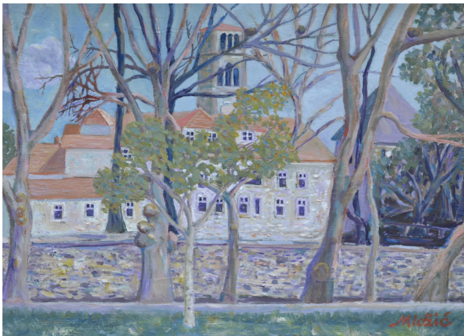
Hotel Bosna , ulje na platnu, 49x64 cm