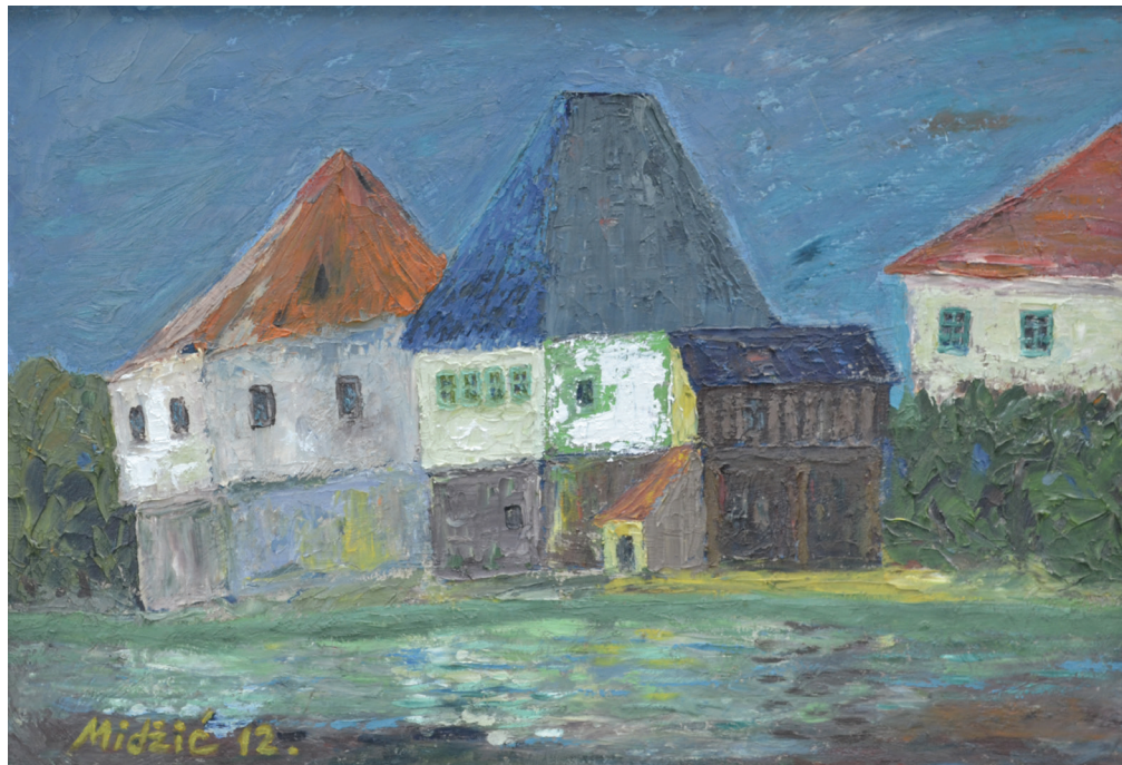
Bosanske kuće , ulje na dasci, 48x69 cm, 2012. godina