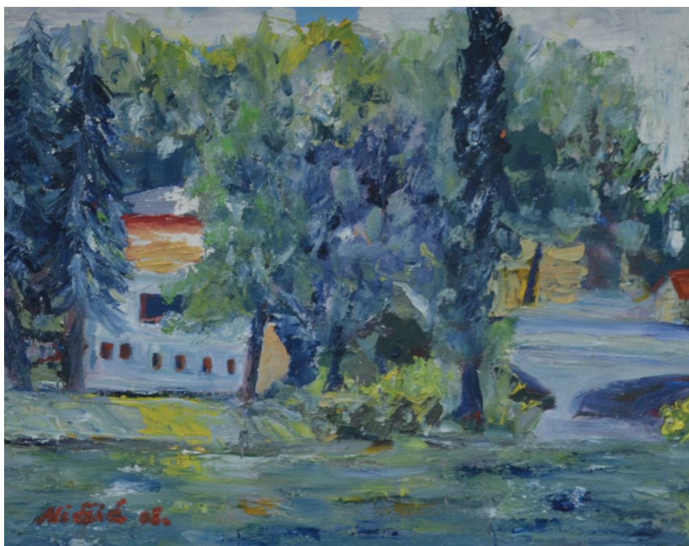
Paviljon , ulje na platnu, 40x50 cm, 2008. godina