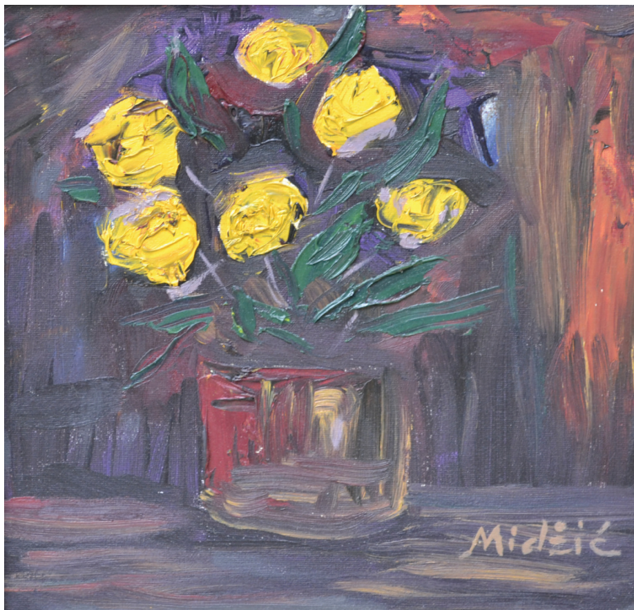
Ruže, ulje na platnu 29x29 cm