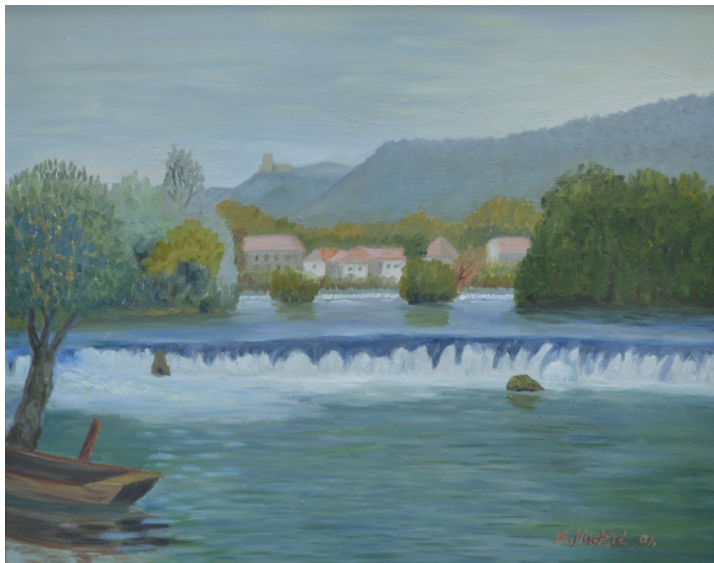
Šarganovića slap , ulje na platnu, 49x60 cm, 2001. godina