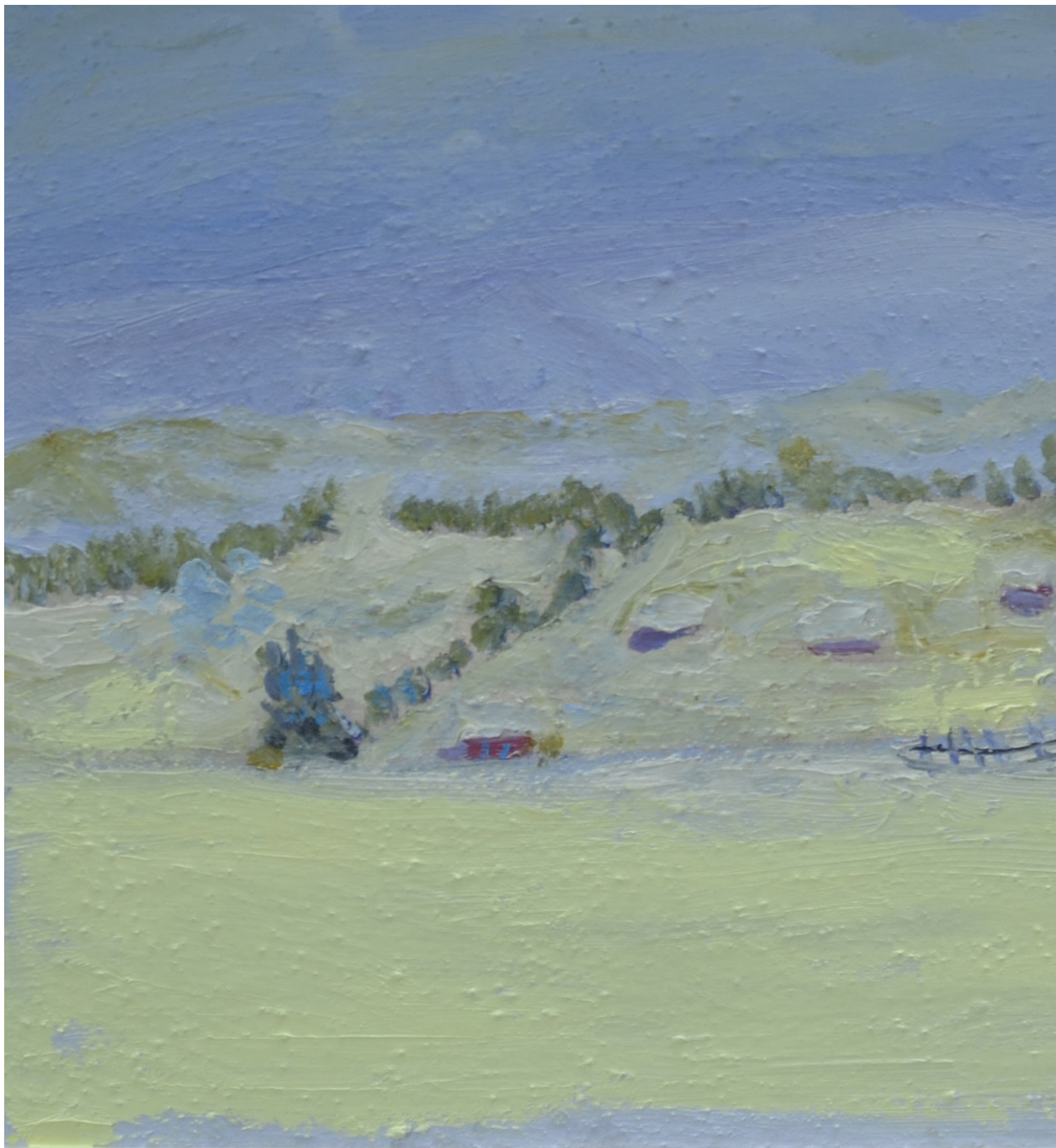
Zima, ulje na šperploči, 28x50 cm