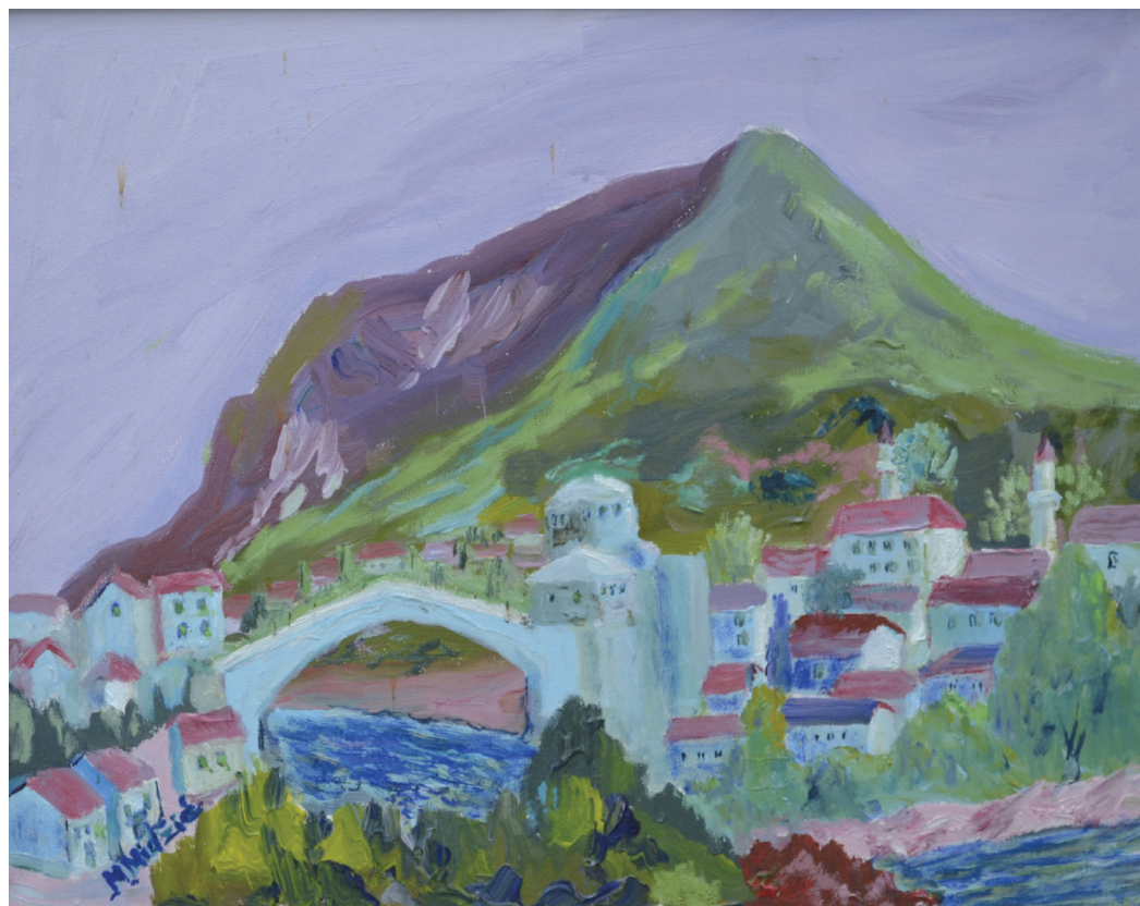
Mostar, ulje na platnu, 39x49cm