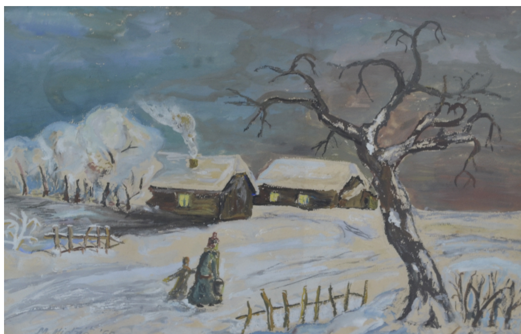
Zimski motiv , tempera na papiru, 29x40 cm, 1960. godina