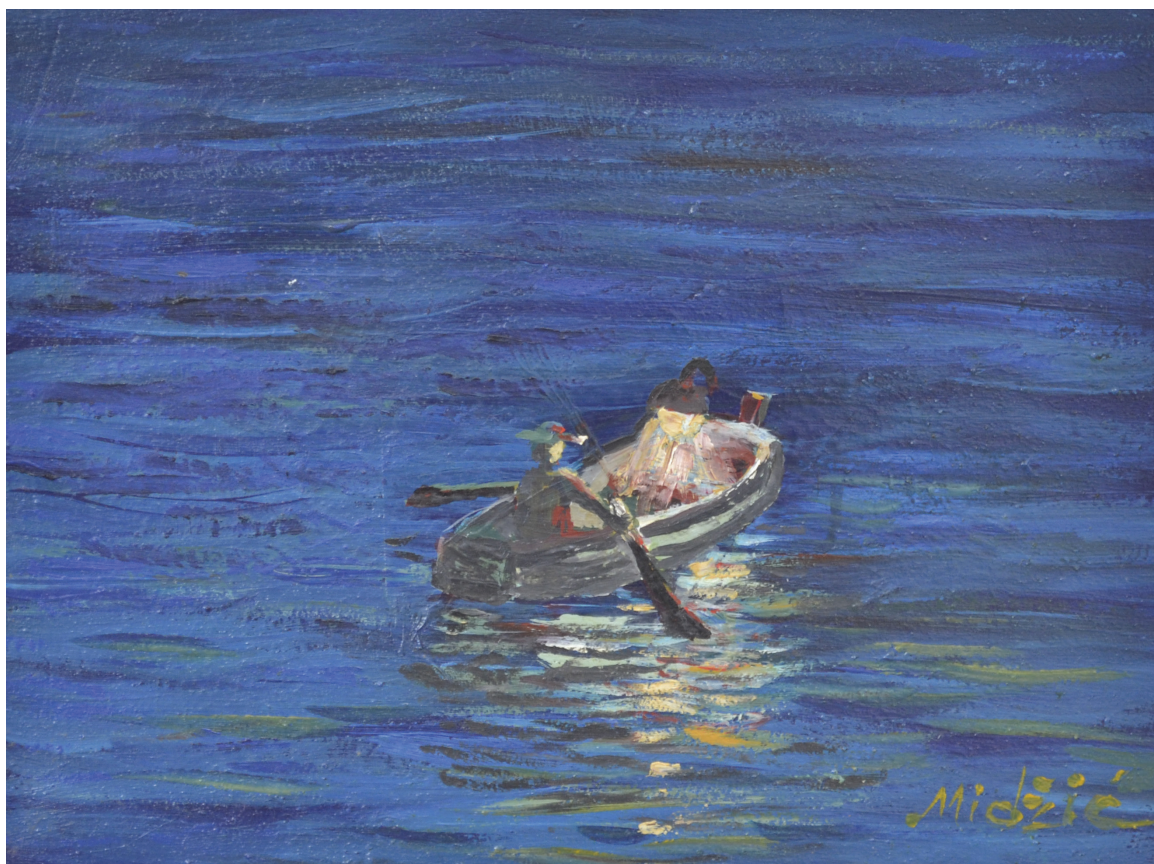
Ribar, ulje na platnu, 30x39 cm