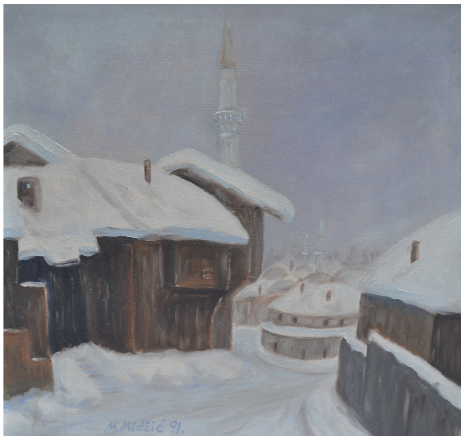
Zima na Bašćaršiji , ulje na platnu, 43x47 cm, 1991. godina