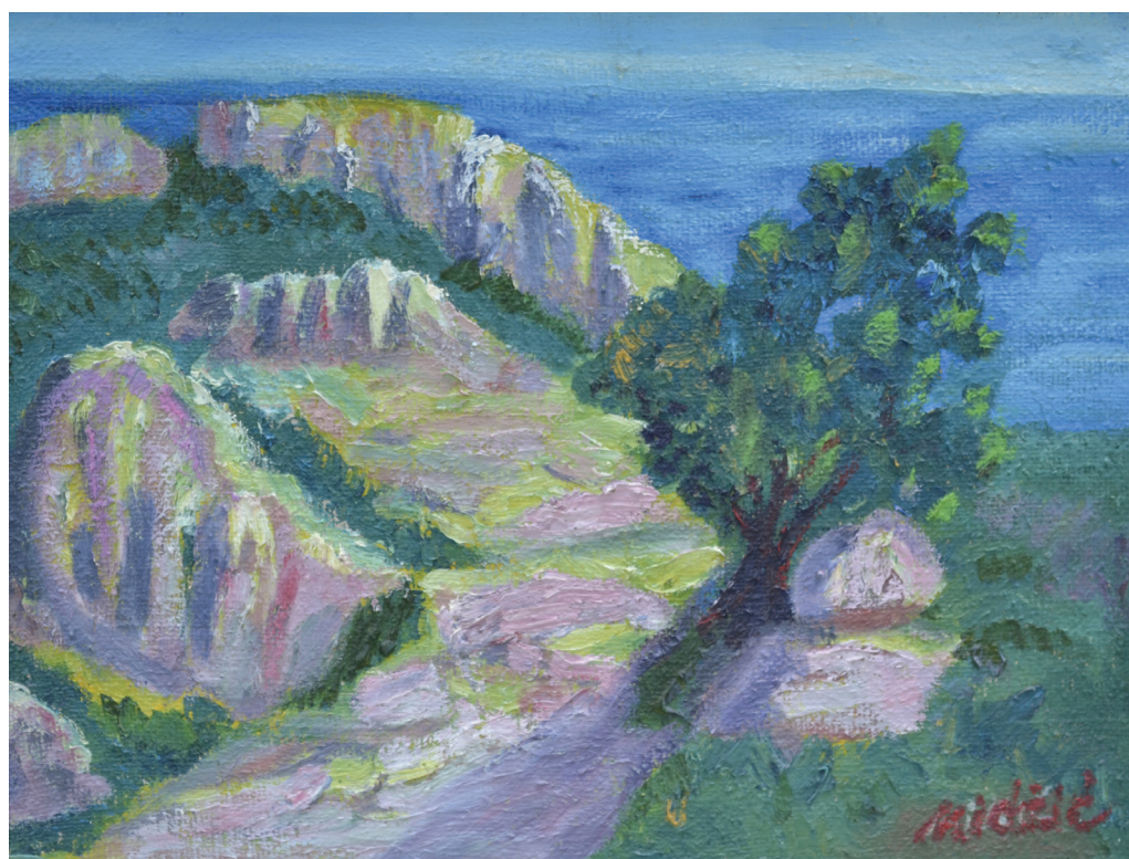
Mediteran , ulje na platnu, 45x59 cm