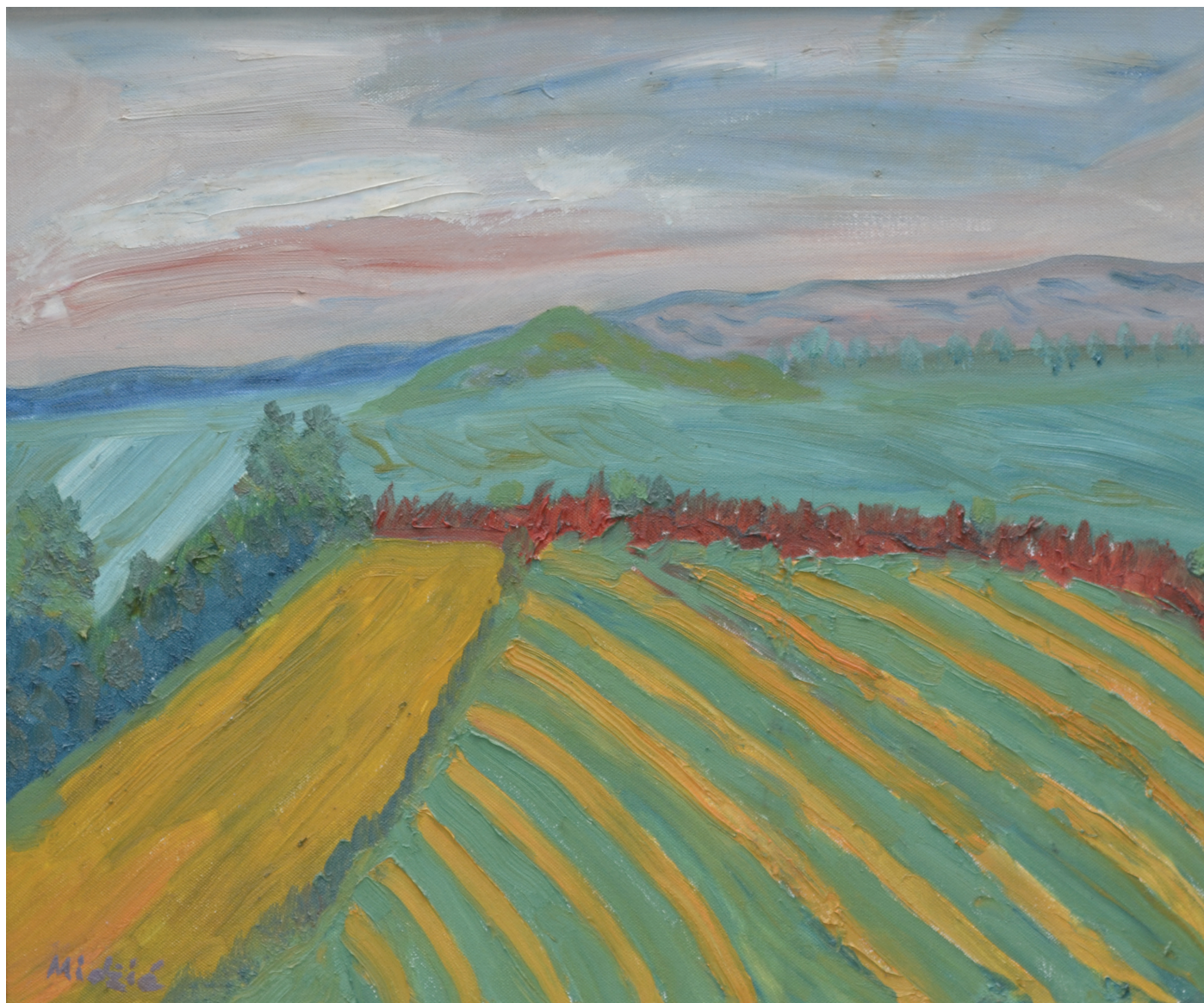
Vinograd , ulje na platnu, 48x58 cm