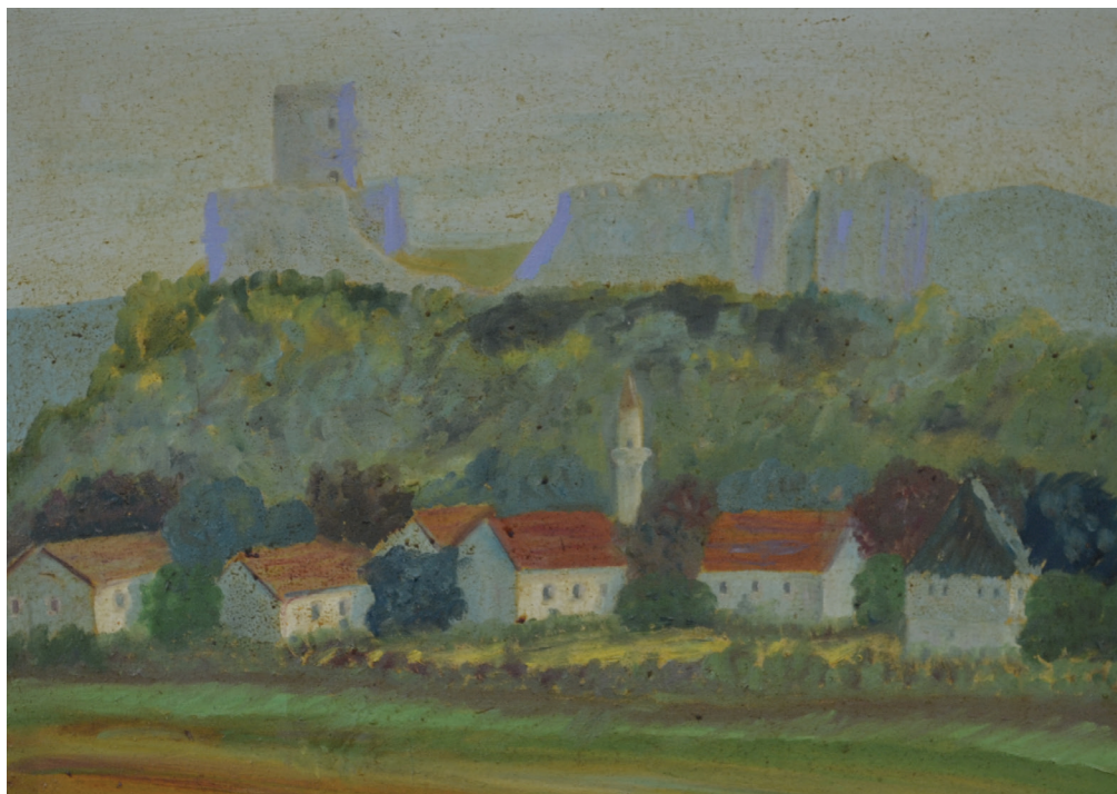
Sokolac , ulje na platnu, 44x54cm, 2001. godina