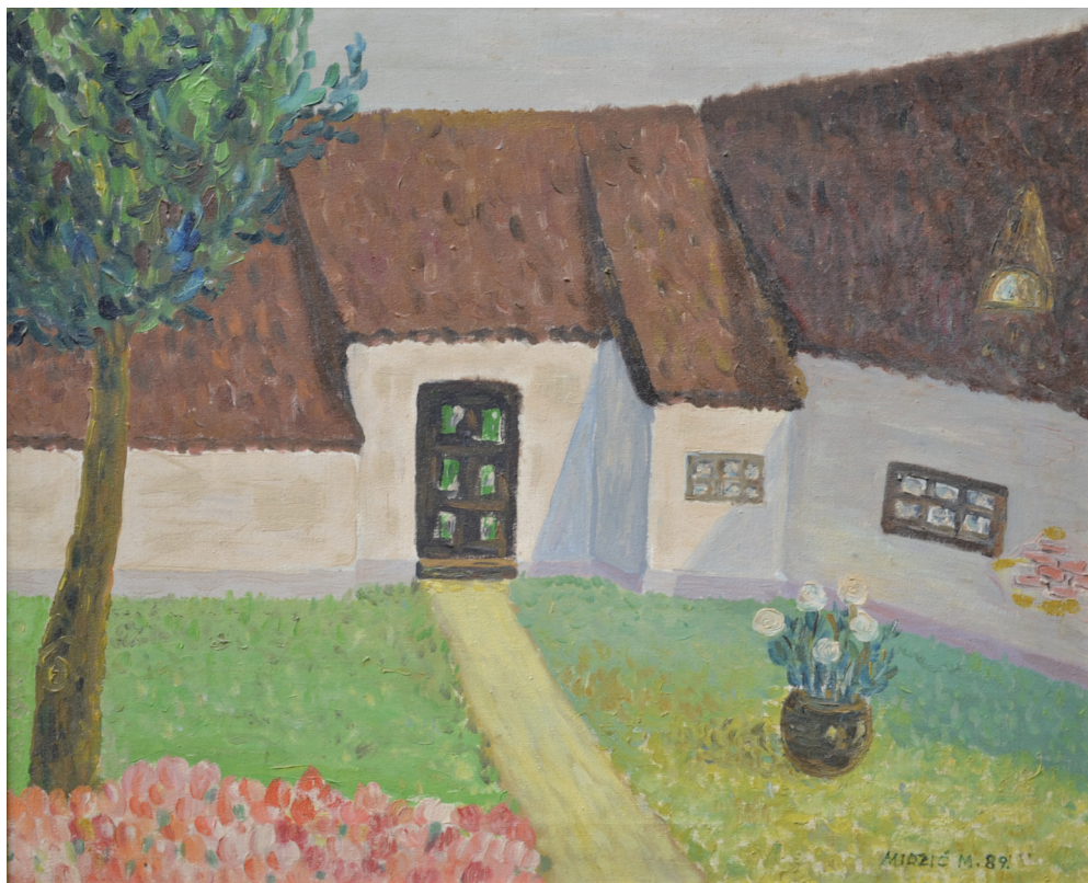
Avlija , ulje na platnu, 41x47 cm, 1989. godina