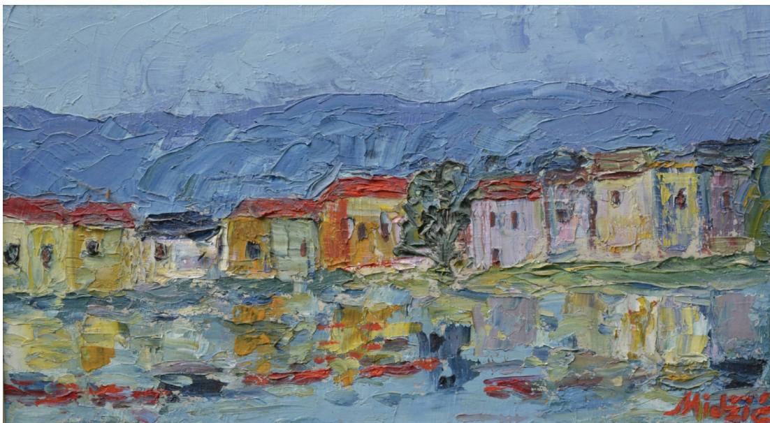
Kuće pored mora , ulje na dasci, 28x49 cm