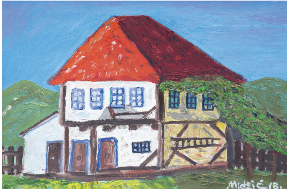
Krajiška kuća , ulje na platnu, 48x70 cm, 2018. godina