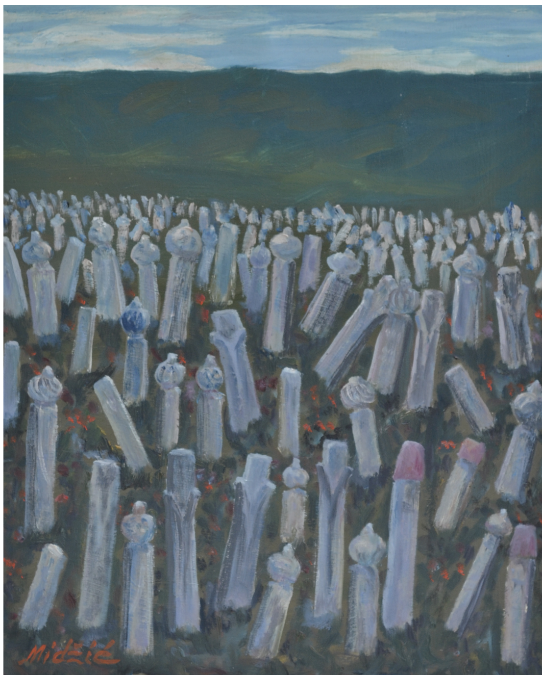
Nišani , ulje na platnu, 55x44 cm.