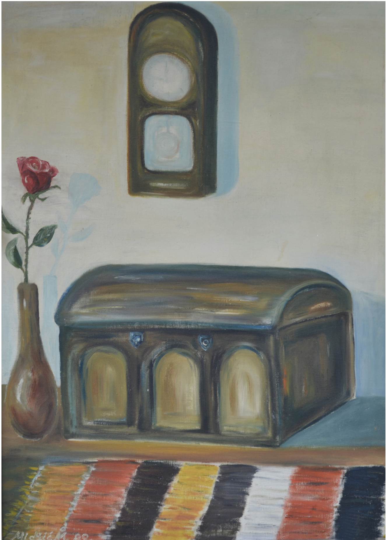
Sehara , ulje na platnu, 80x59 cm, 1989. godina