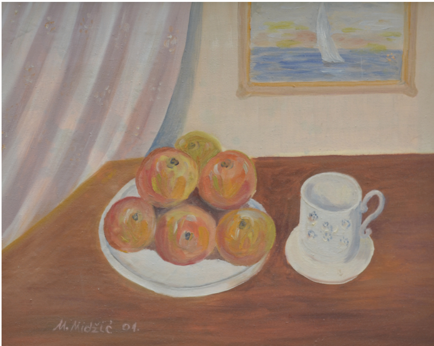
Mrtva priroda , ulje na platnu, 39x49 cm, 2001. godina