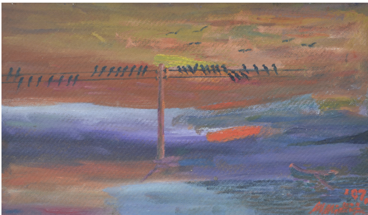
Suton , ulje na šperploči, 31x53cm, 2007. godina