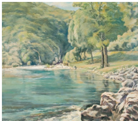
IZVOR RIJEKE KLOKOT ulje na platnu, veličina 60 x 72 cm VI. autor