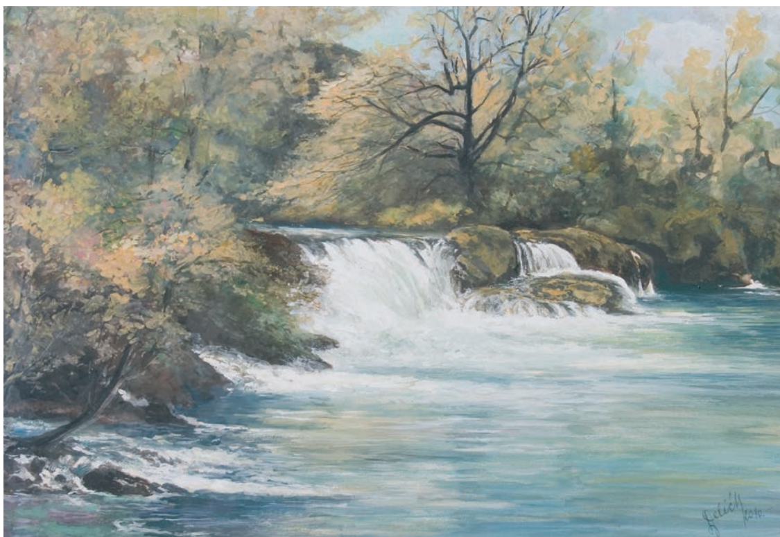
SLAPOVI NA RIJECI UNI – RIPAČ gvaš - tempera, veličina 46 x 32 cm VI. autor