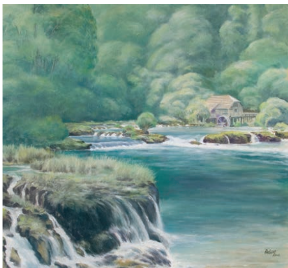
UNA – BOSANSKA OTOKA ulje na platnu, veličina 66 x 70 cm VI. Nermin Delić