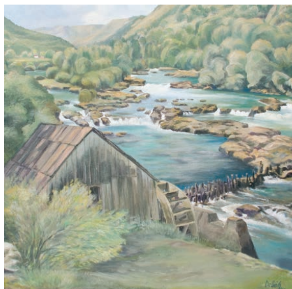
VODENICA U KOSTELIMA ulje na platnu, veličina 70 x 70 cm VI. autor