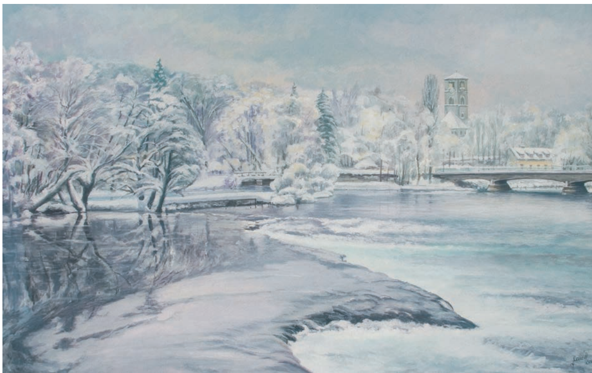
ZIMA NA RIJECI UNI – BIHAĆ gvaš - tempera, veličina 45 x 71 cm VI. autor