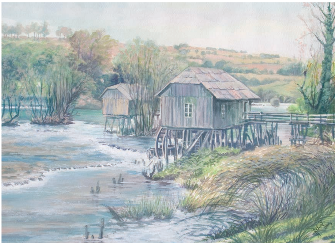
VODENICE U BOSANSKOJ OTOCI gvaš - tempera, veličina 43 x 59 cm VI. autor