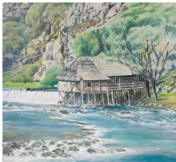
VODENICE NA KLOKOTU ulje na platnu, veličina 68 x 75 cm VI. autor