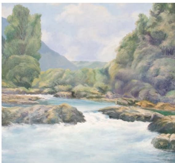
KANJON RIJEKE UNE – KOSTELA ulje na platnu, veličina 57 x 62 cm VI. autor