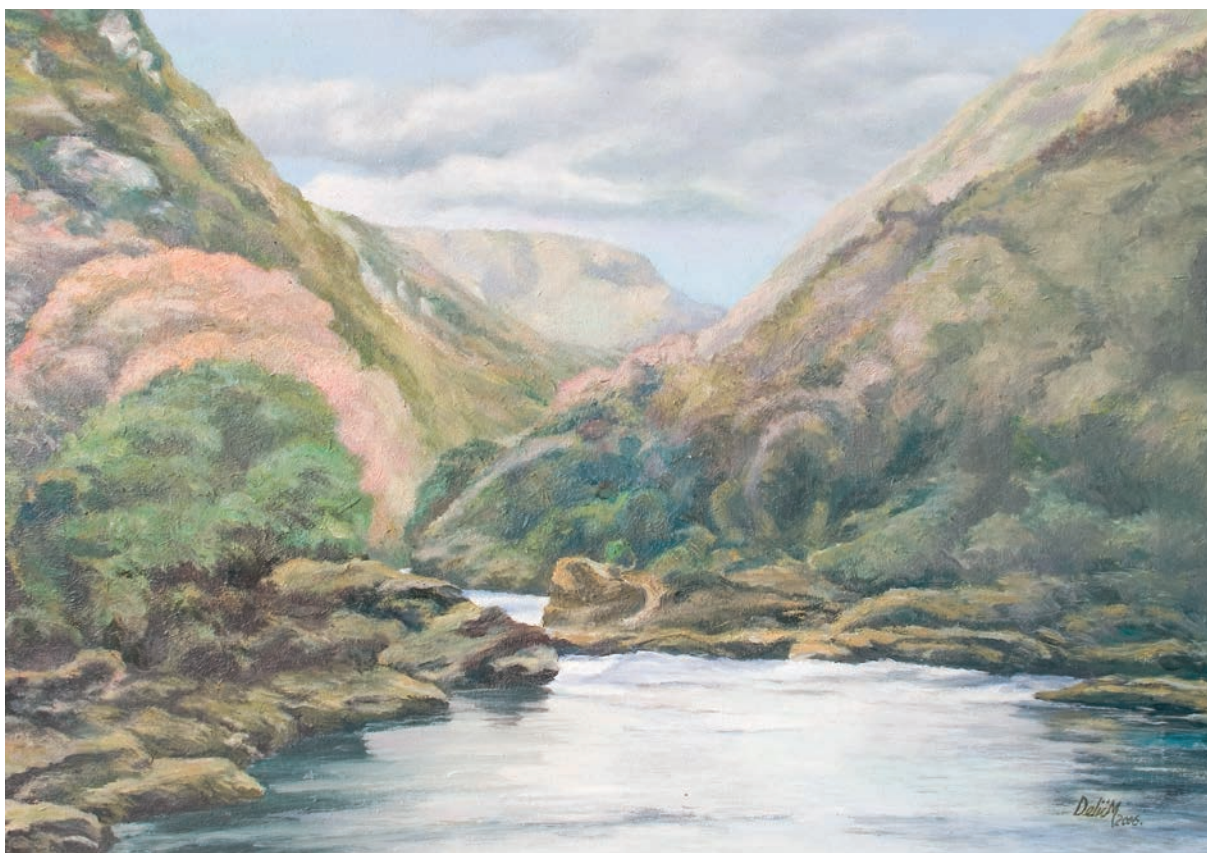
KANJON UNE ulje na platnu, veličina 55 x 74 cm VI. autor