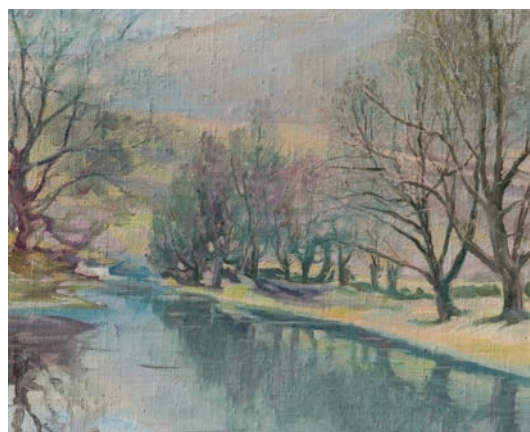
KLOKOT ulje na platnu, veličina 33 x 38 cm VI. porodica Hadžihajdarević