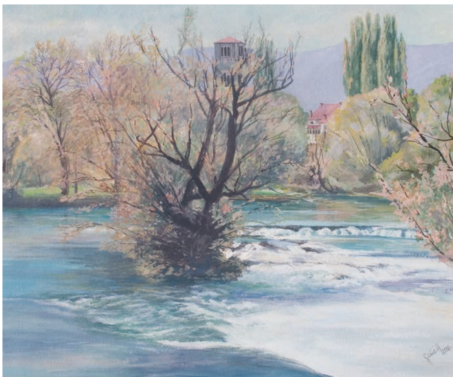
UNA U BIHAĆU gvaš - tempera, veličina 44 x 52 cm VI. autor