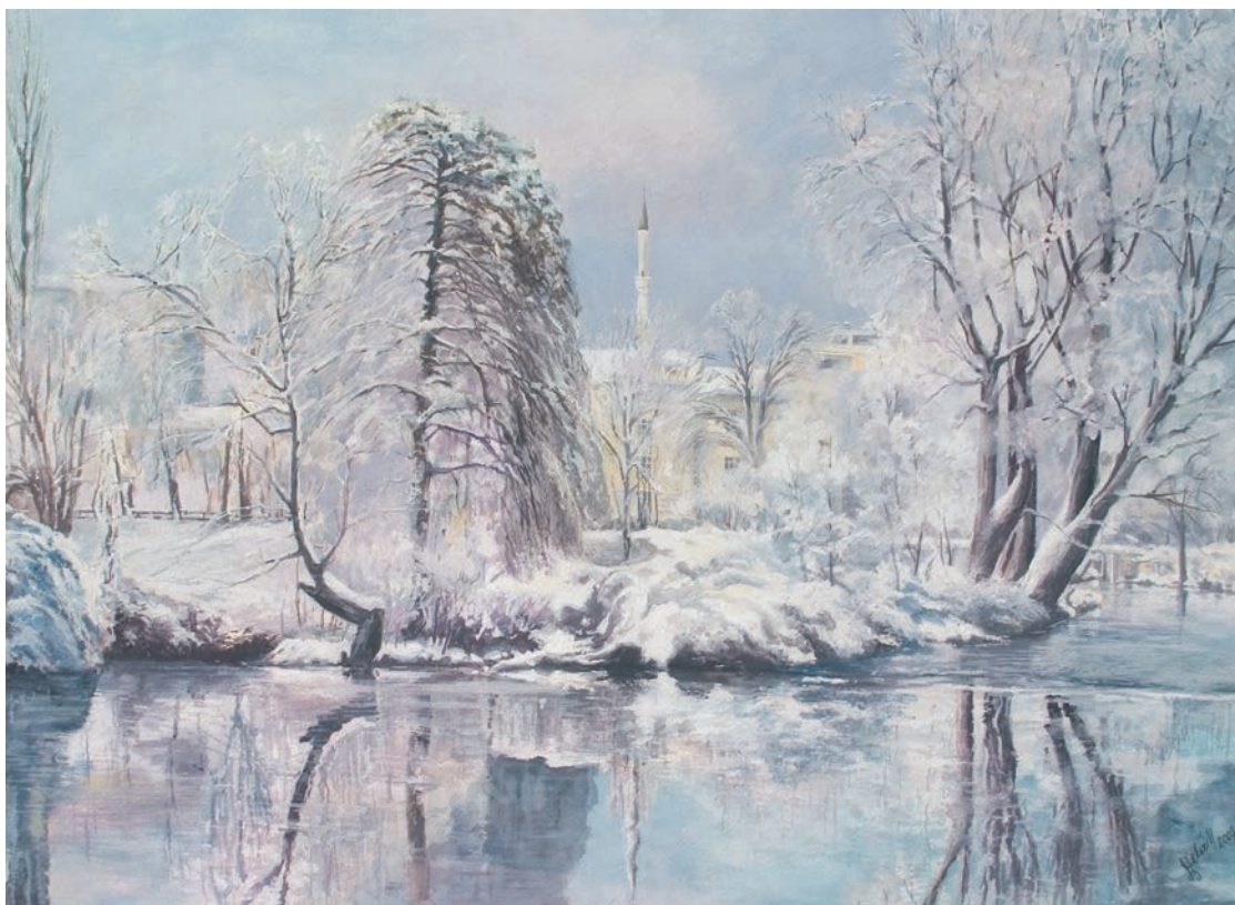
ZIMSKI PEJZAŽ NA RIJECI UNI – BIHAĆ gvaš - tempera, veličina 45 x 71 cm VI. autor