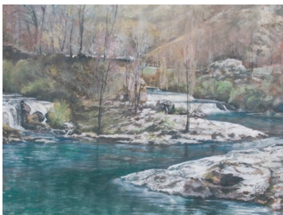
UNA – KOSTELSKI BUK gvaš - tempera, veličina 45 x 60 cm VI. autor