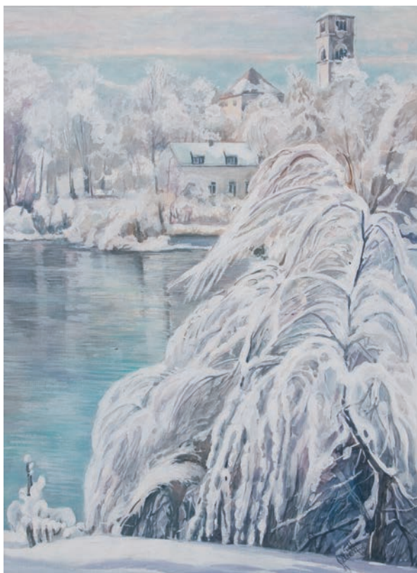
BIHAĆ ZIMI tempera, veličina 47 x 35 cm VI. autor