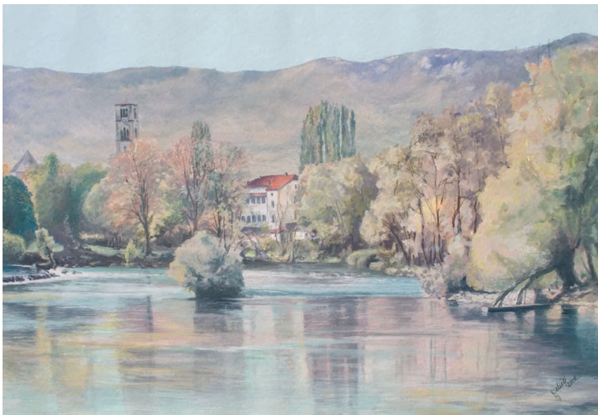
PLANDIŠĆE – BIHAĆ gvaš - tempera, veličina 49 x 70 cm VI. autor