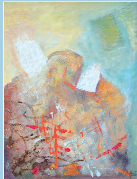
Bez naziva , ulje na kaširanom platnu, 67x52 cm, sign.d.d.u. 2014. godina, vl. umjetnikova porodica