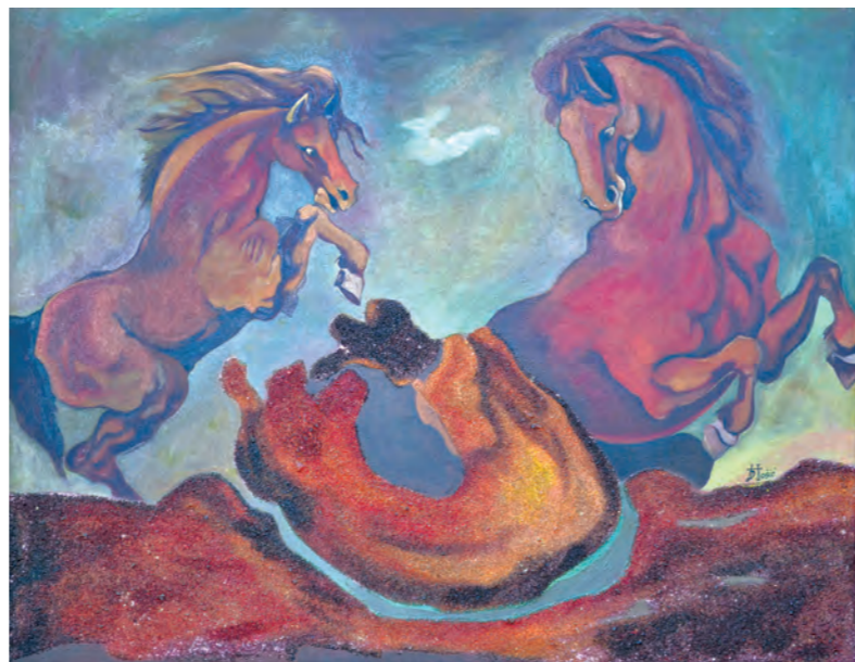
Bez naziva, ulje na platnu, 70x90 cm, sign.d.d.u. nije datirana, vl. Izet Hošić