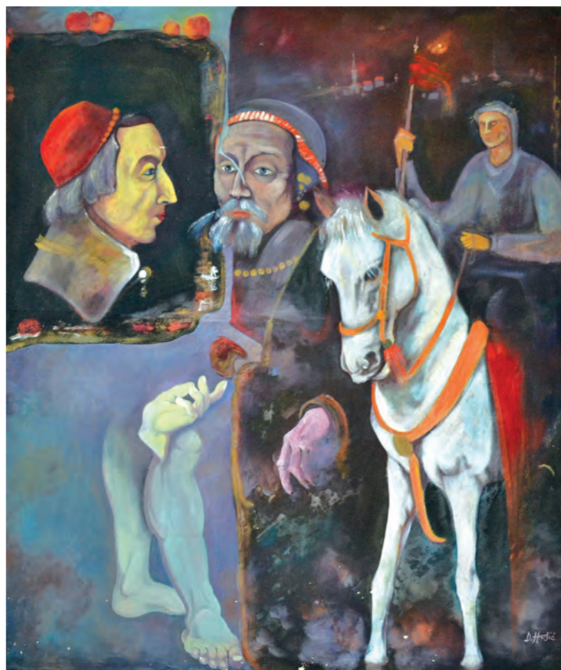
Bez naziva, ulje na platnu, 128x111 cm, sign.d.d.u. nije datirana, vl. JU Kantonalna bolnica Bihać