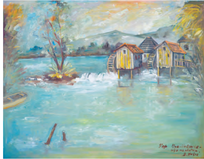
Slap Une-vodenice , ulje na platnu, 71x90 cm, sign.d.d.u. nije datirana, vl. Edis Begatović