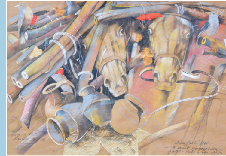
U susret neizbježnom , olovka u boji, 70x100 cm, sign.d.d.u. 1998. godina, vl. Grad Bihac