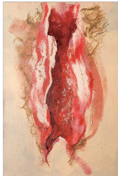
Iz serije Konzumacija (Meat woman) kombinovana tehnika 60x40cm