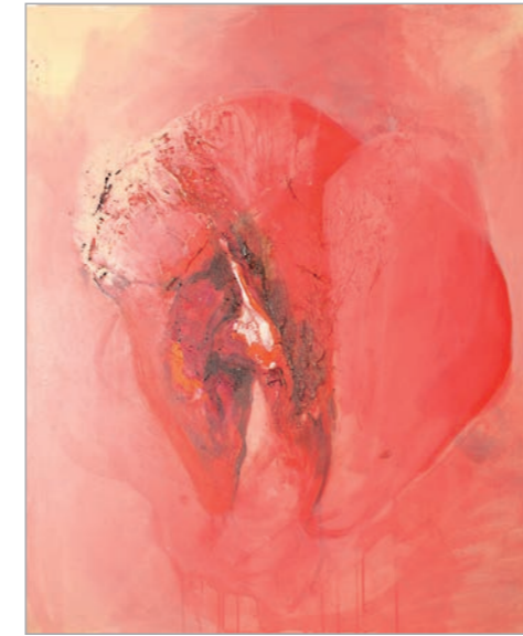
Iz serije Konzumacija (Meat woman) kombinovana tehnika 100x80cm