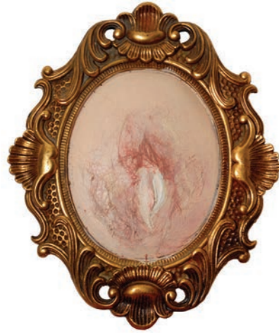
Iz serije Fragmentacija (Flesh For Fantasy) kombinovana tehnika 40x33cm