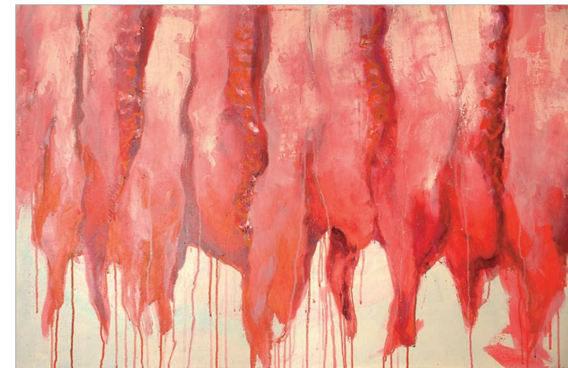
Iz serije Objektivizacija (Meat Curtains) kombinovana tehnika 80x120cm