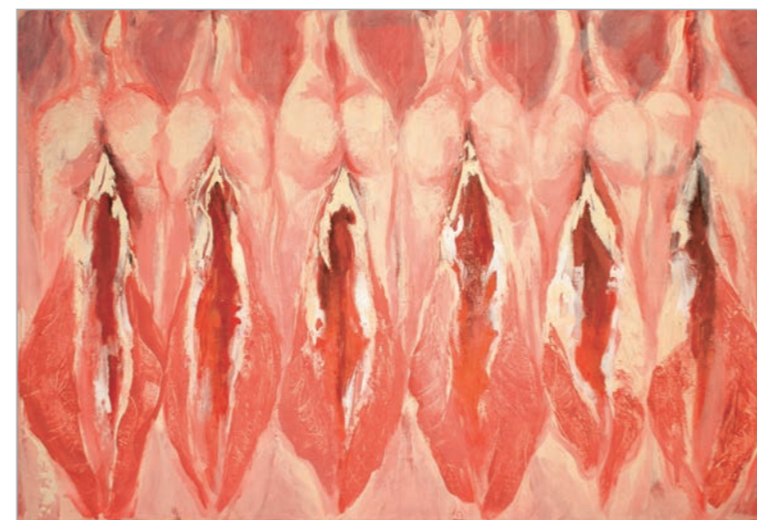
Iz serije Objektivizacija (Meat Curtains) kombinovana tehnika 80x120cm