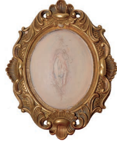
Iz serije Fragmentacija (Flesh For Fantasy) kombinovana tehnika 40x33cm