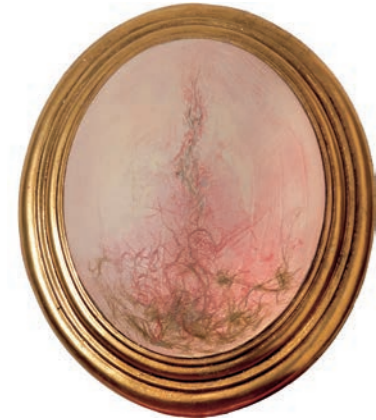
Iz serije Fragmentacija (Flesh For Fantasy) kombinovana tehnika 32x27cm