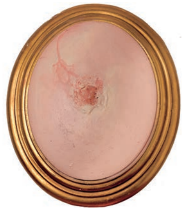
Iz serije Fragmentacija (Flesh For Fantasy) kombinovana tehnika 32x27cm