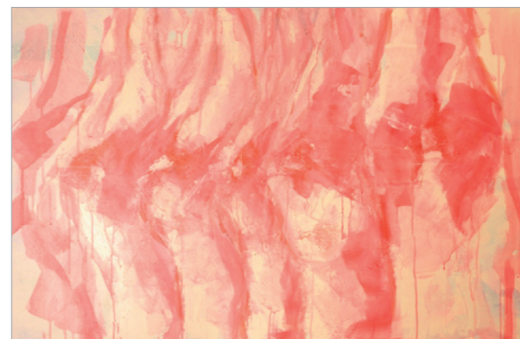
Iz serije Objektivizacija (Meat Curtains) kombinovana tehnika 80x120cm