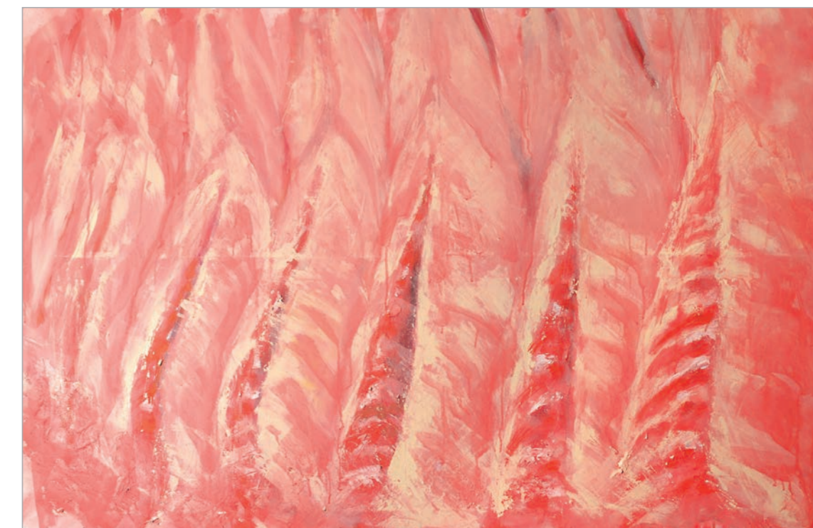
Iz serije Objektivizacija (Meat Curtains) kombinovana tehnika 80x120cm