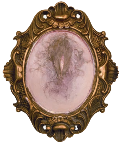
Iz serije Fragmentacija (Flesh For Fantasy) kombinovana tehnika 40x33cm