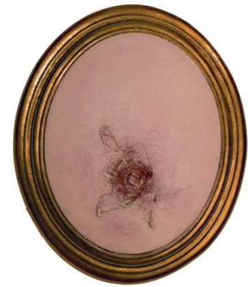
Iz serije Fragmentacija (Flesh For Fantasy) kombinovana tehnika 32x27cm