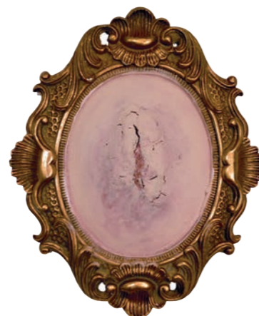
Iz serije Fragmentacija (Flesh For Fantasy) kombinovana tehnika 40x33cm