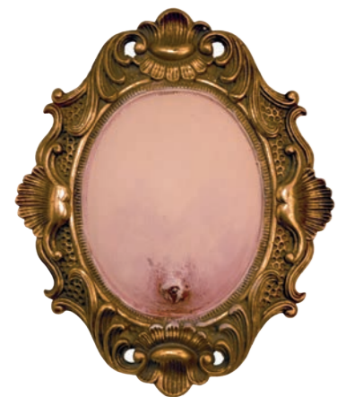
Iz serije Fragmentacija (Flesh For Fantasy) kombinovana tehnika 40x33cm