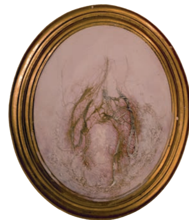
Iz serije Fragmentacija (Flesh For Fantasy) kombinovana tehnika 32x27cm