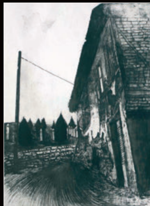
◀ Bez naziva, vernis-mou, akvatinta, bakropis, 84x62,5 cm, 2000. godina