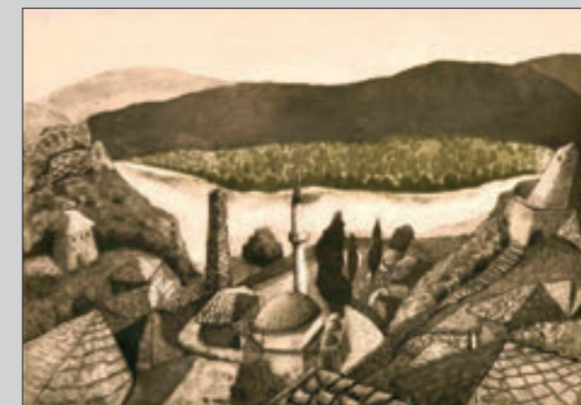
▲ Pogled na Počitelj, aquarelle, vernis-mou, 76x108 cm, 2010. godina