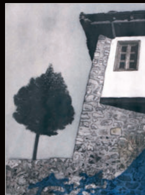
▶ Bez naziva, vernis-mou, akvatinta, bakropis, 84x60,5 cm, 2010. godina