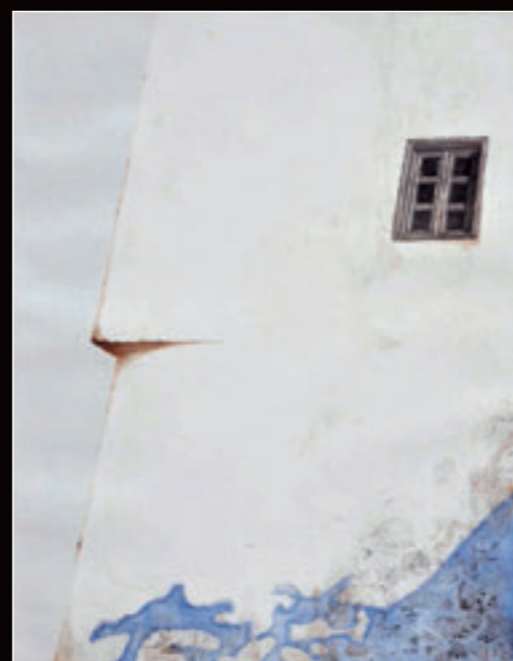
◀ Bez naziva, kombinovana tehnika, 77,5x55 cm, 2011. godina