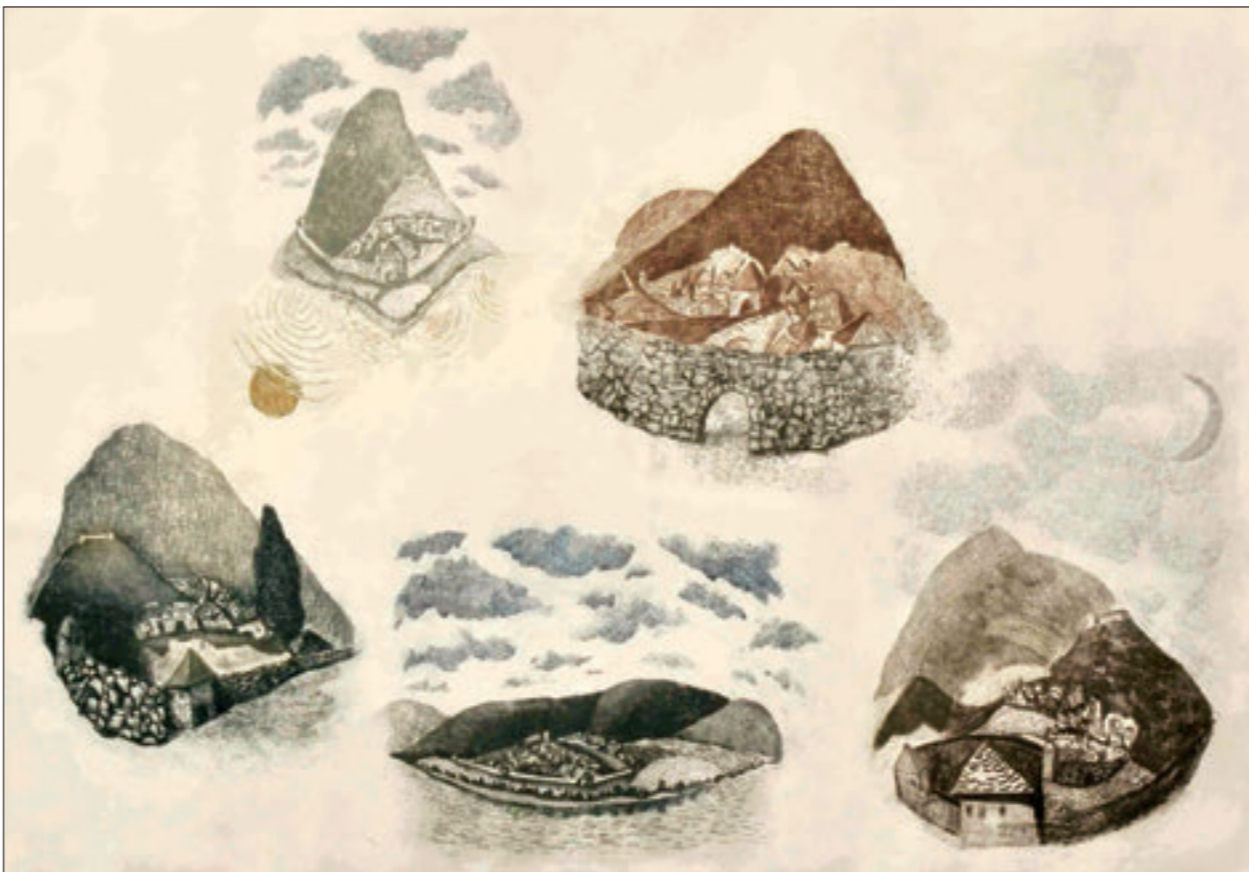
▲ Bosanska alegorija II, vernis-mou, 76x108 cm, 2010. godina