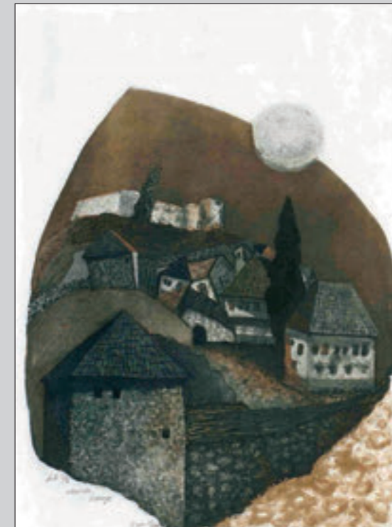
◀ Ima l' jada k'o kad akšam pada, aquarelle, reserve, 76x56 cm