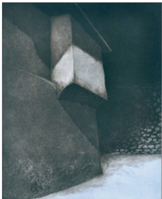
▲ Bez naziva, kombinovano, unikatni otisak, 56x39 cm, 2011. godina