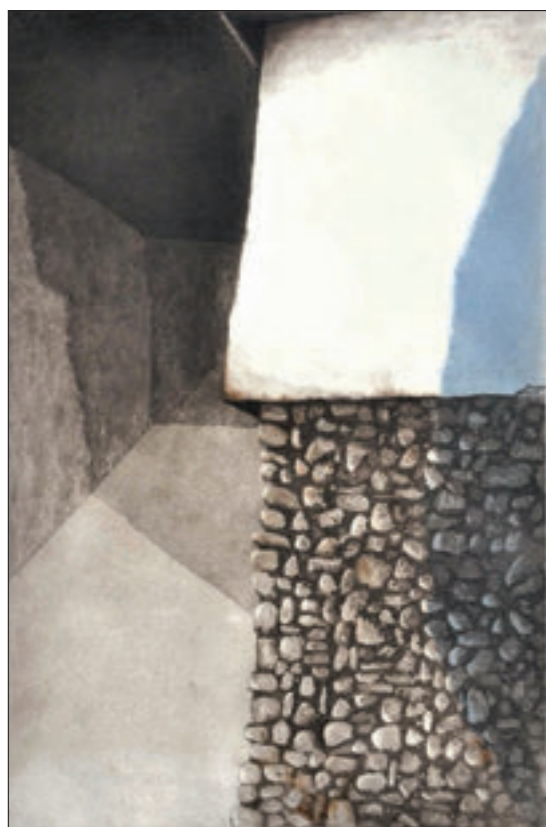
▲ Bez naziva, kombinovano, unikatni otisak, 56x39 cm, 2011. godina

Kontakt: mob.: +387 61 255 759, e-mail: hadzic_amer@hotmail.com