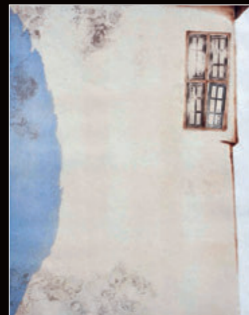
▲ Bez naziva, kombinovana tehnika, 77,5x55 cm, 2011. godina