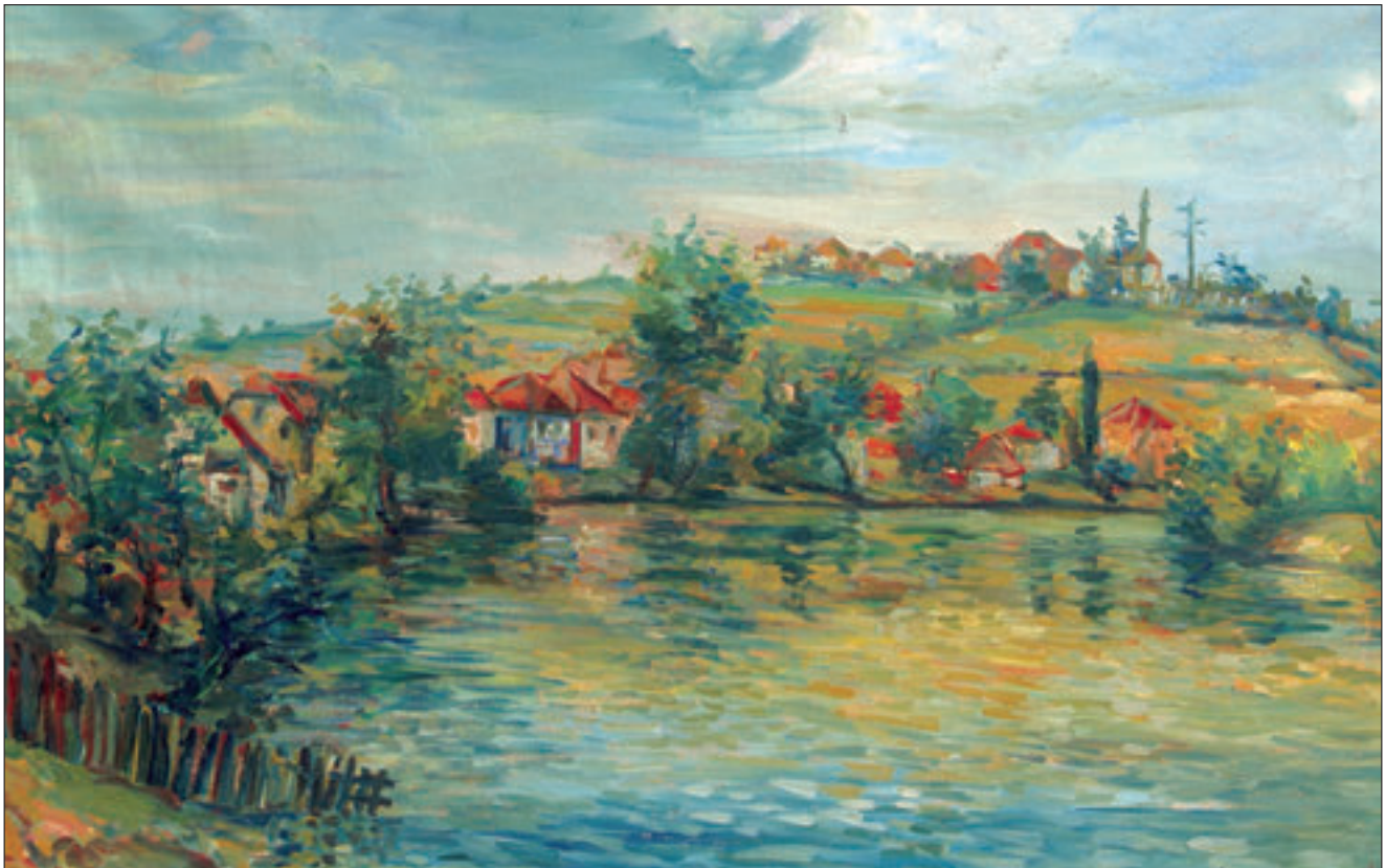
Pokoj, ulje na platnu, 73x107cm, sign DDU, nije datirana, vl. Idriz Zulić