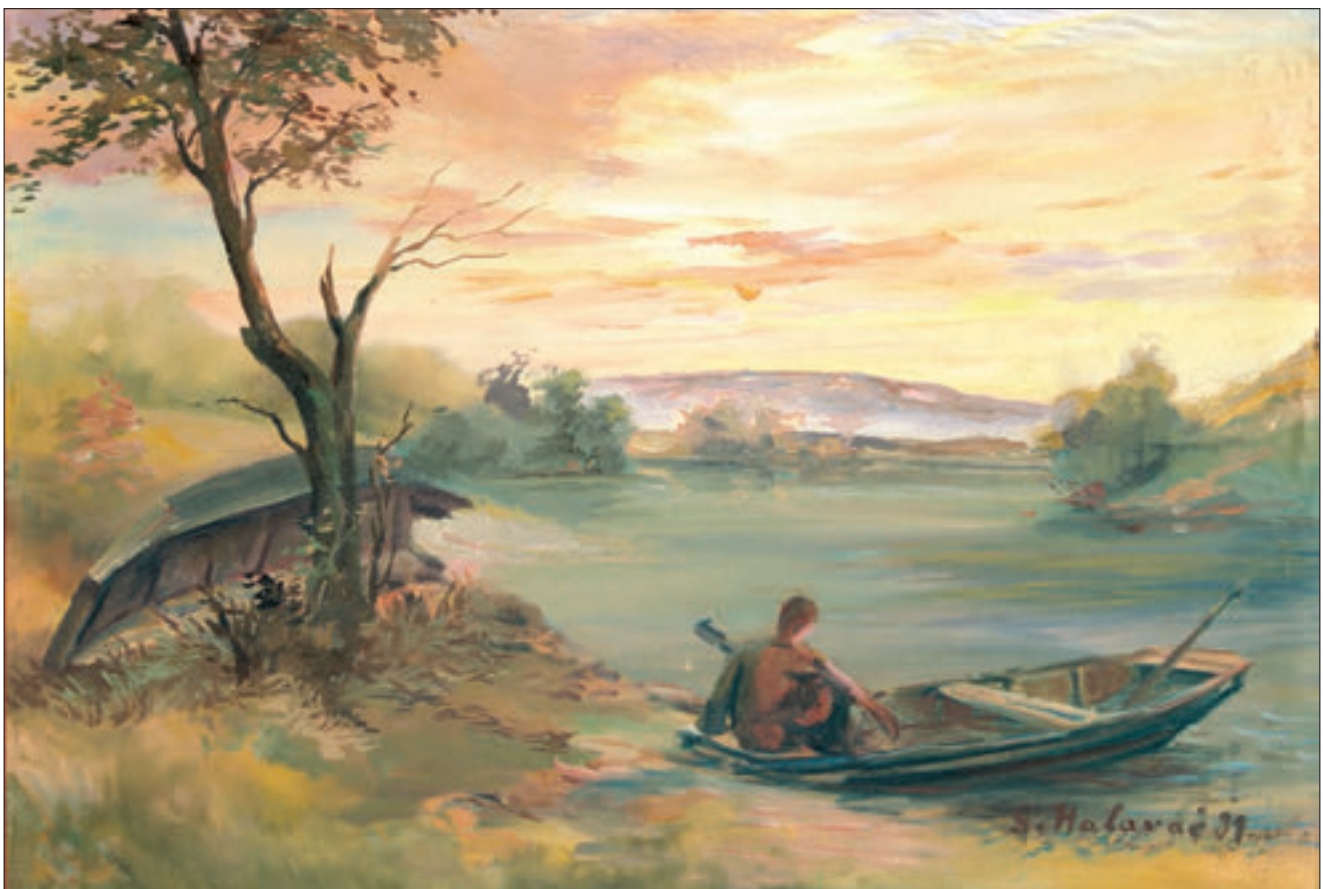
Lađa, ulje na platnu, 50x70cm, sign DDU S. Halavać 91, 1991. godina, vl. Safet Zulić