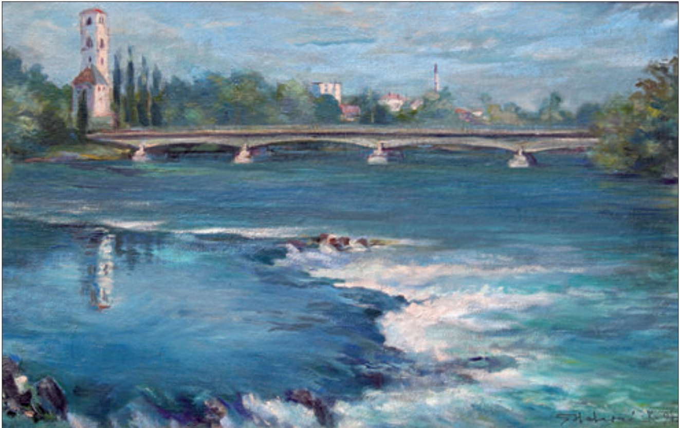
Bihać, ulje na platnu, 61x100cm, sign DDU S. Halavać K. 94, 1994. godina, vlasnik Centar pošta Bihać