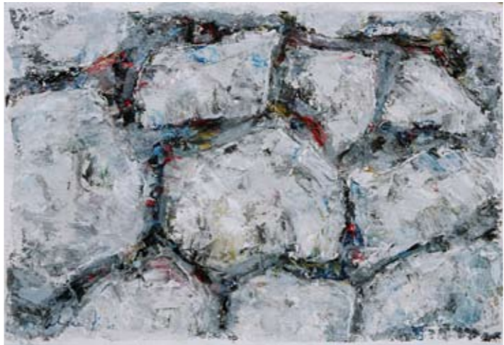
Iz ciklusa: Oblici tla 52x78 cm akrilik na platnu

Ima još jedna komponenta koja se ne smije previdjeti: iako svoju sliku ne rješava po unaprijed određenom planu, u njoj osnovi se prikrija umjetnikovo suvereno vladanje crtežom koji je znatno evidentnije u trenucima kada svoju inspiraciju nalazi u Starom mostu kojim je Alica Jakirović ispunio veliki dio svoga opusa i koji mu se ukazuje u specifičnoj vizuri iz njegovog ateljea, smještenog u najpitoresnijem dijelu grada Mostara, u predvorju Mosta, sa lijeve strane Neretve.