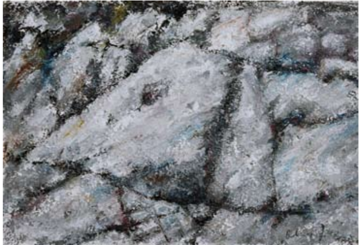
Iz ciklusa: Oblici tla 52x78 cm akrilik na platnu