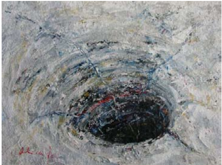
Iz ciklusa: Oblici tla 52x78 cm akrilik na platnu

Karakterologija ligatura čini osnovu za organizaciju kompoziciju slike, ali njima se uobličuje i vizuelni spektar koji emanira iz sebe novu energiju, oslobođenu svih naturalnih nanosa, pročišćenu do svoje emotivne kristalizacije od koje se formira vrhunski sloj stvaralačkog čina – lirski potencijal u čijem se ključu razrješava ideja slike – duh atmosfere.