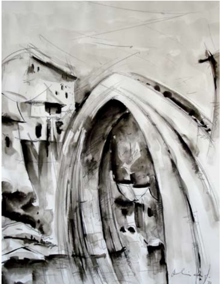
Iz ciklusa: Mostar 70x50 cm lavirani tuš