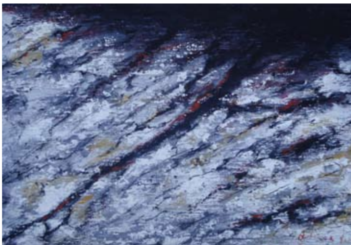
Iz ciklusa: Oblici tla 52x78 cm akrilik na platnu