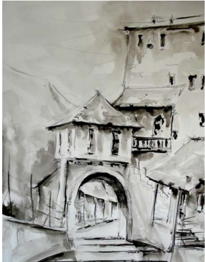
Iz ciklusa: Mostar 70x50 cm lavirani tuš