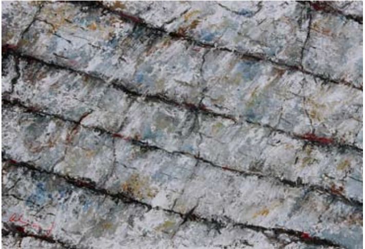
Iz ciklusa: Oblici tla 52x78 cm akrilik na platnu