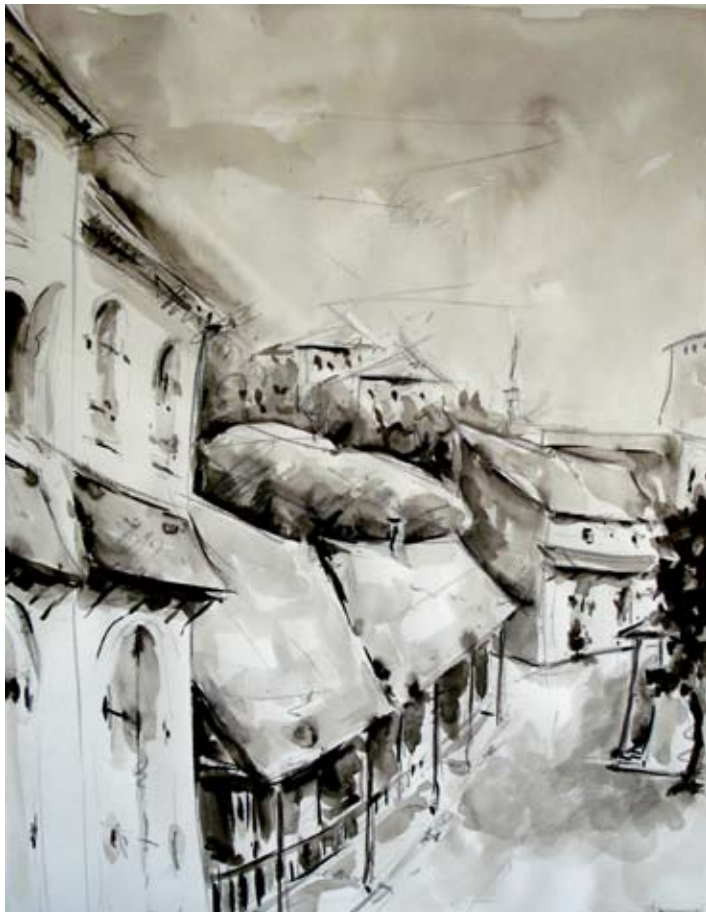
Iz ciklusa: Mostar 70x50 cm lavirani tuš