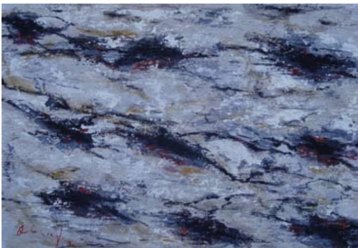
Iz ciklusa: Oblici tla 52x78 cm akrilik na platnu