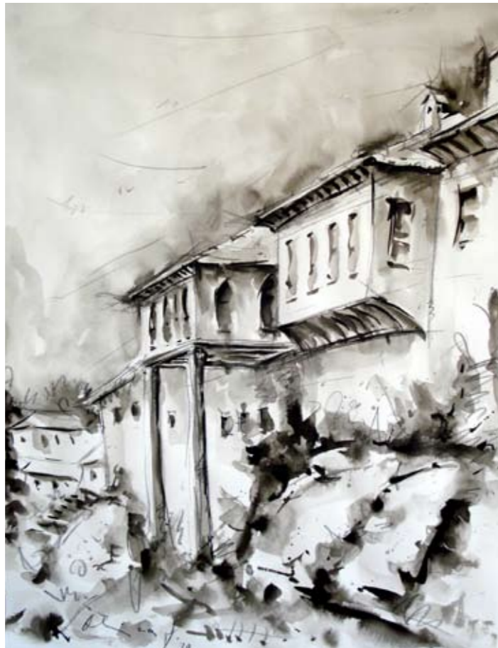
Iz ciklusa: Mostar 70x50 cm lavirani tuš